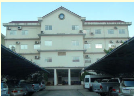
បេឡាជាតិរបបសន្តិសុខសង្គម