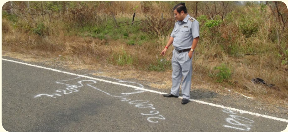
ការចុះអង្កេត នៅកន្លែងកើតហេតុ

មិនឈៀងចូលទៅកន្លែងផ្សេង ដែល ករណី នេះ បេឡាជាតិរបបសន្តិសុខសង្គម ចាត់ទុកថា ជាគ្រោះថ្នាក់ការងារ។ ដោយឡែកជនរងគ្រោះ នៅលើ ហើយមិនមែនជាមេគ្រួសារ និងមិន មានអ្នកនៅក្នុងបន្ទុក ដូច្នេះក្រុមគ្រួសារនៃជន រងគ្រោះទទួលបានអត្ថប្រយោជន៍ ពី ប.ស.ស