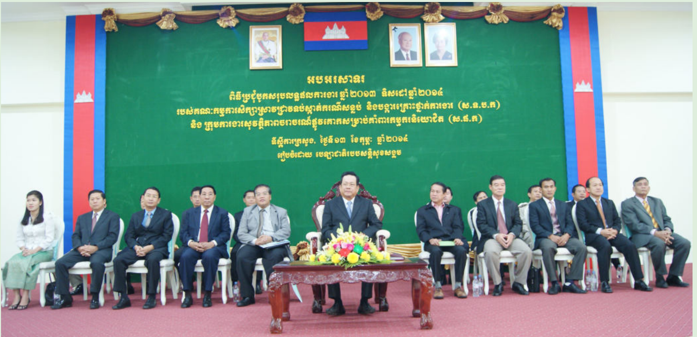
ឯកឧត្តមបណ្ឌិត អ៊ុត សំហេង រដ្ឋមន្ត្រីក្រសួងការងារ និងបណ្តុះបណ្តាលវិជ្ជាជីវៈ បានអញ្ជើញចូលរួមជាអធិបតី