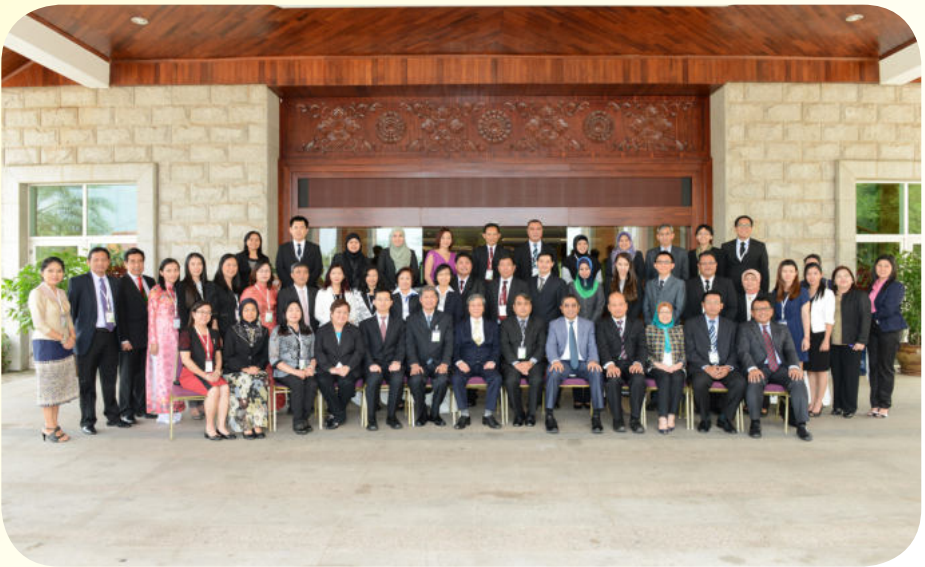
ការថតរូបអនុស្សាវរីយ៍

ស្របគ្នានោះដែរ ក្រុមលេខាធិការដ្ឋាន ក៏បាន