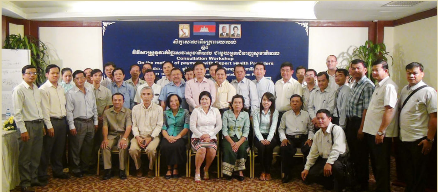
ការចូលរួមថតរូបអនុស្សាវរីយ៍របស់សិក្ខាកាម