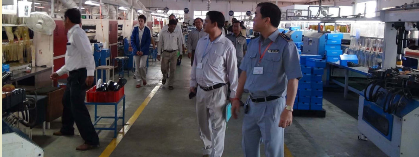
ការអញ្ជើញត្រួតពិនិត្យ របស់ក្រុមការងារនៅរោងចក្រ ស្ថិតករណីសន្លប់ និងការបង្ការគ្រោះថ្នាក់ផ្សេងៗ (Cambodia)

ពីស្ថានភាពអ្នកជំងឺដែលបានសន្លប់។ ចំពោះ ញាប់ច្រើនដងបាន លុះត្រាតែមានការសហការ រាល់ការចំណាយ ទៅលើ មធ្យោបាយដឹក ជញ្ជូន យ៉ាងស្មិតរមួត និងមានការទទួលខុសត្រូវខ្ពស់ពី និយោជក និងកម្មករនិយោជិតផ្ទាល់ផងដែរ។ រ៉ាប់រងទាំងស្រុង។ ករណីដួលសន្លប់នេះដែរ ដើម្បីទប់ស្កាត់ ករណីនេះកុំឱ្យកើតឡើងញឹក