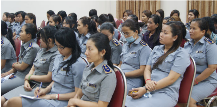
ការចូលរួមរបស់នារី ប.ស.ស ក្នុងពិធីប្រារព្ធ

ថ្ងៃទិវាសិទ្ធិនារីអន្តរជាតិ ០៨មីនា គឺជាថ្ងៃដែលបណ្តាប្រទេសទូទាំងពិភពលោក បានប្រារព្ធជាដៀងរាល់ឆ្នាំ ដើម្បីឧទ្ទិសដល់វិភាគរបស់នារី ដែលបានតស៊ូប្រឆាំងនឹងការរើសអើងសិទ្ធិ ក្នុងការងារសិទ្ធិ ចូលរួមបោះឆ្នោត សិទ្ធិឈរឈ្មោះឱ្យគេបោះឆ្នោត សិទ្ធិក្នុងការទទួលបានការអប់រំបណ្តុះបណ្តាល សិទ្ធិចូលរួមក្នុងការកាន់តំណែង នៅក្នុងស្ថាប័នសាធារណៈ និងទាមទារឱ្យមានការ បញ្ឈប់ការរើសអើងនឹងនារីដែលជាភេទទទេនខ្សោយ។ ដើម្បីចូលរួមអបអរសាទរថ្ងៃដ៏មានអត្ថន័យនេះ បេឡាជាតិរបបសន្តិសុខសង្គម បានរៀបចំពិធីអបអរសាទរទិវាសិទ្ធិនារីអន្តរជាតិ នាថ្ងៃទី០៨ ខែមីនា ឆ្នាំ