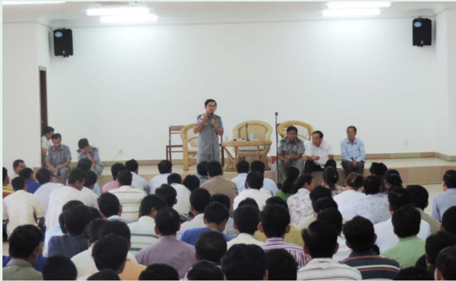
ការផ្តល់មតិណែនាំរបស់មន្ត្រី ប.ស.ស ដល់សមាជិកថ្មី

បន្ទាប់ពីបានចុះចែកប័ណ្ណធានារ៉ាប់រងជូនដល់កម្មករនិយោជិត ដែលបម្រើការងារនៅក្នុងសហគ្រាស គ្រឹះស្ថានមួយចំនួនក្នុងខេត្តកំពង់ចាមរួចមក បេឡាជាតិរបបសន្តិសុខសង្គមបាននឹងកំពុងរៀបចំប័ណ្ណធានារ៉ាប់រង ជូនដល់កម្មករនិយោជិតដែលបម្រើការងារ នៅក្នុងសហគ្រាស គ្រឹះស្ថាន ដែលបានចុះបញ្ជីកាជាមួយបេឡាជាតិរបបសន្តិសុខសង្គម ជាបន្តបន្ទាប់ទៀត។ “ប័ណ្ណធានារ៉ាប់រងហានិភ័យការងារចែកជូន ចំពោះតែកម្មករនិយោជិតណា ដែលបម្រើការងារ នៅក្នុងសហគ្រាស គ្រឹះស្ថាន ដែលបានចុះបញ្ជីកា ជាមួយបេឡាជាតិរបបសន្តិសុខសង្គមតែប៉ុណ្ណោះ។”