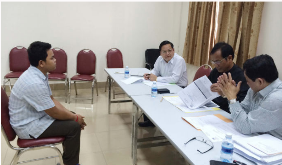
កិច្ចពិគ្រោះយោបល់របស់គណៈកម្មការ ទៅលើការព្យាបាលរបស់ជនរងគ្រោះ

ការងារតិចជាង ២០ភាគរយ ប.ស.ស ត្រូវបើកប្រាក់ធនលាភឱ្យគាត់តែម្តងគត់ ដោយឡែកបើជនរងគ្រោះ ដែលបាត់បង់សមត្ថភាពការងារ