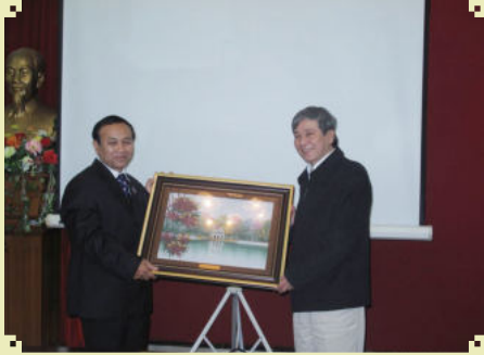
រូបថតប្រគល់វត្ថុអនុស្សាវរីយ៍