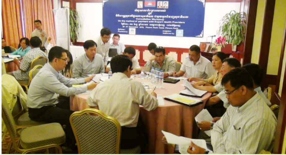
កិច្ចពិភាក្សាជាក្រុមរបស់សិក្ខាកាម