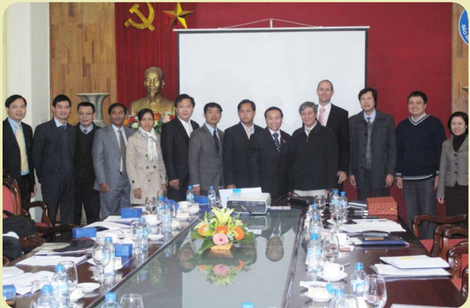
រូបថតអនុស្សាវរីយ៍ នៃកិច្ចសហប្រតិបត្តិការធានារ៉ាប់រងសុខភាពកម្ពុជា និងវៀតណាម

កិច្ចសិក្សានៅ ទីក្រុងហាណូយ នៃសាធារណរដ្ឋសង្គមនិយមវៀតណាម ក្នុងគោលបំណងស្វែងយល់ អំពីការធានារ៉ាប់រងសុខភាព នៅអង្គការសន្តិសុខសង្គម ប្រទេសវៀតណាម { Vietnam Social securit (VSS)} និងធ្វើការផ្លាស់ប្តូរទិសដៅនៃផលប្រយោជន៍នេះបានអនុវត្តន៍ដោយជោគជ័យកន្លងមក។