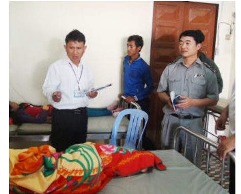
ការចុះអង្កេត និងតាមដានអាការៈសន្តបនៅតាមគ្លីនិក

គ្លីនិកឯកជន និងមណ្ឌលសុខភាពដែលនៅជិតនោះបានទាន់ពេលវេលា។