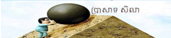
(ប្រាសាទ សិលា)

គ្រប់សេចក្តីព្យាយាមមិនប្រាកដថា សុទ្ធតែបានសម្រេចទាំងអស់នោះទេ តែគ្រប់សេចក្តីសម្រេចទាំងអស់ ក៏បានមកពីការព្យាយាម