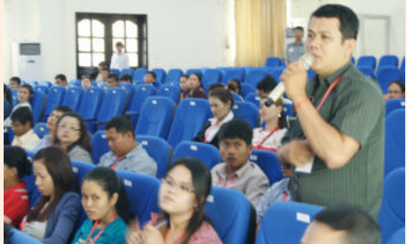
ទិដ្ឋភាពរួម នៃសំណួរ-ចម្លើយក្នុងអង្គពិធី