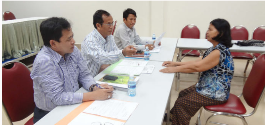
ការតាមដាន និងវាយតម្លៃនូវកម្រិតបាត់បង់សមត្ថភាពរបស់ជនរងគ្រោះ

ចាប់ពី ២០ ភាគរយឡើងទៅ ត្រូវទទួលបានអត្ថប្រយោជន៍ពី ប.ស.ស ដោយបើកប្រាក់មួយត្រីមាសម្តង ពីធនាគារអេស៊ីលីដា ជារៀងរហូត។ ទន្ទឹមនឹងនោះ គណៈកម្មការ បានកំណត់ថ្លៃដើម្បីបើកកិច្ចប្រជុំ ក្នុងការវាយតម្លៃ ជនរងគ្រោះដ៏ទៃទៀត ដែលបានទទួលរង គ្រោះថ្នាក់ក្នុងម៉ោងការងារផងដែរ។ ជនរងគ្រោះដែលបានបាត់បង់សមត្ថភាពការងារ ត្រូវមកទទួលការវាយតម្លៃ នៅបេឡាជាតិ របបសន្តិសុខសង្គម ក្នុងរយៈពេល ១ឆ្នាំម្តង តាមការកំណត់របស់គណៈកម្មការ វេជ្ជសាស្ត្រ ដើម្បីកំណត់កម្រិត នៃការបាត់បង់សមត្ថភាពការងារសារជាថ្មី។