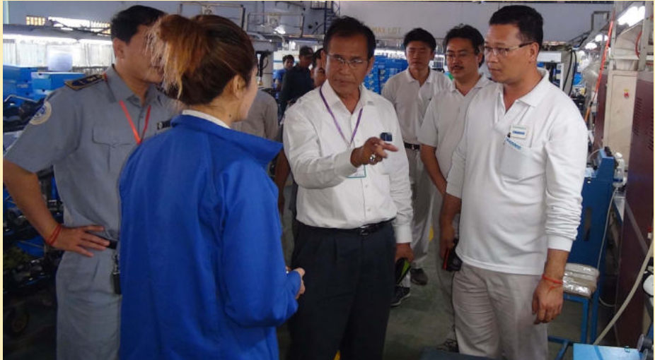
សកម្មភាពចុះធ្វើការណែនាំដល់តំណាងរោងចក្រឱ្យអនុវត្តតាមលក្ខខណ្ឌការងារ

នៅថ្ងៃទី២៧ ខែកុម្ភៈ ឆ្នាំ២០១៤ វេលាម៉ោង ៩:៤០នាទីព្រឹក គណៈកម្មការសិក្សាស្រាវជ្រាវ ទប់ស្កាត់ករណីសន្លប់ និងបង្ការគ្រោះថ្នាក់ការងារ(ស.ទ.ប.ក)បានចុះអង្កេតករណីដួលសន្លប់ ដែលកើតមានឡើងនៅរោងចក្រ SHIMANO (CAMBODIA)CO.,LTD អាសយដ្ឋានស្ថិតនៅ ឃុំត្រពាំងគង ស្រុកសំរោងទង ខេត្តកំពង់ស្ពឺ មានកម្មការិនីចំនួន២៧នាក់ បានដួលសន្លប់ក្នុង ចំណោមកម្មករនិយោជិត ចំនួន៩៥៥ នាក់ ។ ករណីដួលសន្លប់នេះ បានកើតមានឡើងនៅ វេលាម៉ោង៧:៣០នាទីព្រឹកបើតាមការសន្ទនា របស់គណៈកម្មការ ស.ទ.ប.ក គឺបណ្តាលមក ពីការថែមម៉ោង ក្លិនការបិទស្បែកជើង បូករួម នឹងសុខភាពទន់ខ្សោយ បណ្តាលឱ្យមានអាការៈ ឈឺក្បាល ងងឹតមុខ វិលមុខ ងងឹតដេងរហូតដល់ មានការដួលសន្លប់ ហើយមានការភ្ញាក់ផ្អើល ដួលសន្លប់តៗគ្នាថែមទៀត។ បន្ទាប់ពីការដួល សន្លប់ របស់កម្មករនិយោជិត រោងចក្របាន សហការជាមួយអង្គការពាក់ព័ន្ធ និងភ្នាក់ងារ ប.ស.ស ដើម្បីបញ្ជូនជនរងគ្រោះ ទៅគ្លីនិក និងសេវាព្យាបាលគឺ ប.ស.ស ជាអ្នកធានា ឯកជន និងមណ្ឌលសុខភាព ហើយគណៈ កម្មការ ស.ទ.ប.ក បានចុះពិនិត្យ ដើម្បីសាកសួរ ដើម្បីទប់ស្កាត់ ករណីនេះកុំឱ្យកើតឡើងញឹក