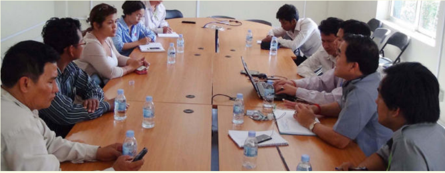
ការប្រជុំណែនាំរបស់គណៈកម្មការ ដល់តំណាងរោងចក្រ