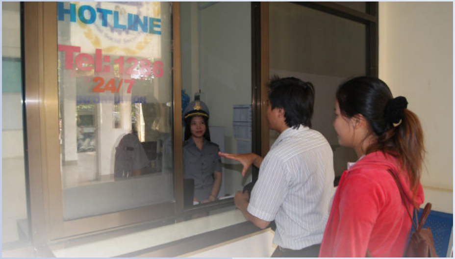
សកម្មភាពទំនាក់ទំនងការងារ របស់អតិថិជនជាមួយ Hotline

ទន្ទឹមនឹងទទួលបានលទ្ធផលជាផ្នែកក្តី ក៏នៅមានបញ្ហាប្រឈមមួយចំនួនដែរដែល តម្រូវឱ្យក្រុមការងារ HOTLINE នៅតែខិត ខំប្រឹងប្រែងដោះស្រាយ រាល់ការប្រឈមនោះ ឲ្យមានភាពរលូន និងរហ័សទាន់ ពេលវេលា ដើម្បីបម្រើសេវាសាធារណៈ ជូនដល់សមា ជិក នៃបេឡាជាតិរបបសន្តិសុខសង្គម ឲ្យ បានល្អបន្ថែមទៀត។