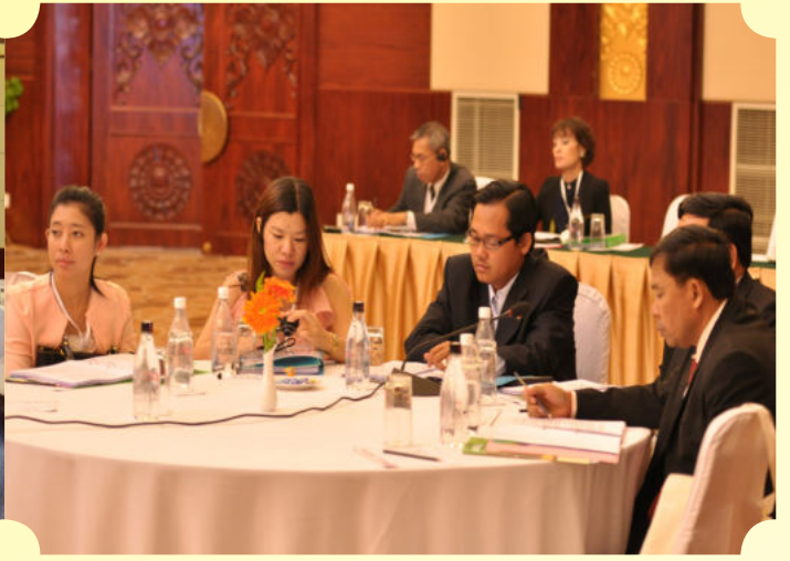
ទិដ្ឋភាពរួមនៃកិច្ចប្រជុំ

ប្រទេសកម្ពុជា ប្រុយណេ ឥណ្ឌូនេស៊ី ឡាវ ម៉ាឡេស៊ី ថៃ ហ្វីលីពីន សិង្ហបុរី និង វៀតណាម។