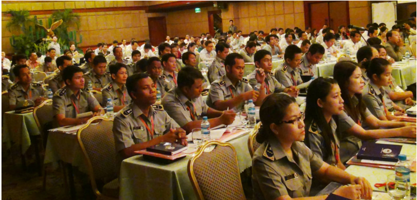
ទិដ្ឋភាពចូលរួមរបស់មន្ត្រី ប.ស.ស ថ្នាក់កណ្តាល និងប.ស.ស តាមបណ្តាខេត្ត ព្រមទាំងអង្គការពាក់ព័ន្ធ

លោកនាយក ប.ស.ស បានបន្ថែមថាថ្វីត្បិតតែយើងទទួលបានលទ្ធផលល្អ យ៉ាងណាក្តី ក៏យើងនូវតែ មានចំណុច ប្រឈមខ្លះដែលជៀសមិនរួចទាមទារឲ្យយើងត្រូវធ្វើការ ដោះស្រាយឲ្យបានទាន់ពេលវេលា ទោះបីការប្រឈម ខ្លះជាកត្តាសត្យានុម័តក៏ដោយ ហើយយើងក៏ត្រូវ