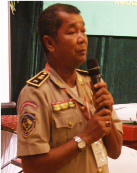
ឧត្តមសេនីយ៍ត្រី លុយ ឈិន អញ្ជើញបកស្រាយសំណួរក្នុងវេទិកា ពង្រឹងបន្ថែមនូវការបម្រើសេវាសាធារណៈ ជូនដល់កម្មករនិយោជិត យើងឲ្យបានតាមតម្រូវការ និងឲ្យបានល្អផងដែរ។