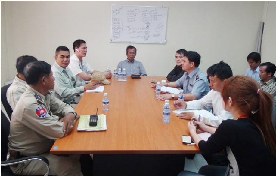
កិច្ចប្រជុំពិគ្រោះយោបល់ស្រាវជ្រាវទប់ស្កាត់ករណីដែលនាំឱ្យដួលសន្តប

កាលពីថ្ងៃទី២០ ខែមករា ឆ្នាំ២០១៤ វេលាម៉ោង ១:១០នាទីរសៀល គណៈកម្មការសិក្សាស្រាវជ្រាវ ទប់ស្កាត់ករណីសន្តប និងបង្ការគ្រោះថ្នាក់ការងារ (ស.ទ.ប.ក) បានចុះអង្កេតករណីកម្មករដួលសន្តប ដែលកើតមានឡើងនៅរោងចក្រ WANSHEN CLOTHING (CAMBODIA) Co.,LTD មានកម្មការិនីចំនួន ៣៣នាក់ បានដួលសន្តបក្នុងចំណោមកម្មករនិ-