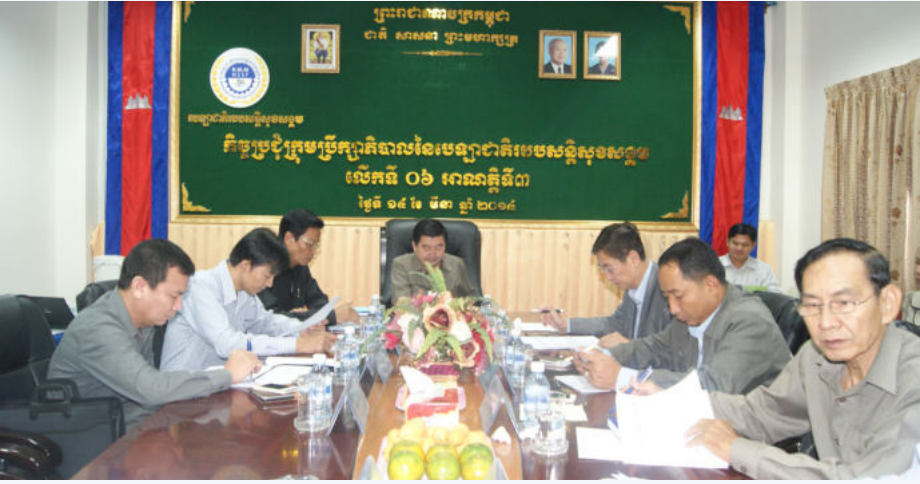
ការពិនិត្យ និងពិភាក្សាលើរបៀបវារៈក្នុងកិច្ចប្រជុំ

ក្នុងទិសដៅអនុវត្តបន្តនៅពេលខាងមុខក្រុមប្រឹក្សាភិបាល នៃបេឡាជាតិរបបសន្តិសុខសង្គម មានគម្រោង នឹងធ្វើការពិភាក្សាលើបញ្ហាមួយចំនួនធំទៀតនៅជំហានទី២ គឺរបបធានារ៉ាប់រងសុខភាព និងចាប់ដំណើរការនៅពាក់កណ្តាលឆ្នាំ២០១៤ នេះព្រមទាំងពិភាក្សាលើច្បាប់លិខិតបទដ្ឋាននានាដ៏ទៃទៀត តាមស្ថានភាពជាក់ស្តែង នៃតម្រូវការរបស់ ប.ស.ស។