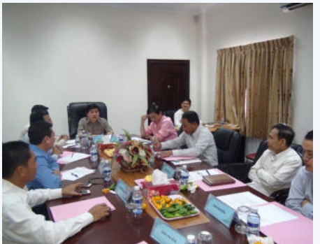
ដំណើរ នៃកិច្ចប្រជុំ

ជាច្រើនទៀត។ ជាក់ស្តែងកាលពីពេលថ្មីៗនេះ ក្រុមប្រឹក្សាភិបាល បានបើកកិច្ចប្រជុំលើកទី៤ អាណត្តិទី៣ នៅថ្ងៃទី០២ ខែមករា ឆ្នាំ២០១៤ និងលើកទី៥ អាណត្តិ៣ នៅថ្ងៃទី២៤ ខែមករា ឆ្នាំ២០១៤ តាមរបៀបវារៈដែលបានគ្រោងទុកមានដូចជា៖ ការកែសម្រួល និងបន្ថែមនៃលក្ខន្តិកៈបុគ្គលិក បេឡាជាតិរបបសន្តិសុខសង្គម និងការពិនិត្យលើរបាយការណ៍បូកសរុបលទ្ធផលការងារសម្រេចបានឆ្នាំ២០១៣ និងទិសដៅអនុវត្តបន្ត របស់គណៈកម្មការសិក្សាស្រាវជ្រាវទប់ស្កាត់ករណីសន្លប់និងបង្ការគ្រោះ