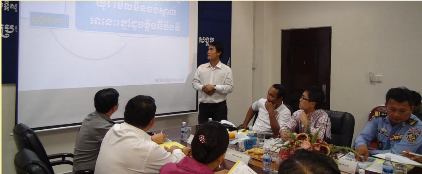
ការធ្វើបទបង្ហាញរបស់អ្នកជំនាញ

ការប្រជុំផ្សព្វផ្សាយអប់រំណែនាំដល់អ្នកបើកបរយានយន្តដឹកកម្មករតាមបណ្តាសហគ្រាស និងតាមរយៈការផ្សព្វផ្សាយផ្សេងៗទៀត ឱ្យបានត្រឹមត្រូវ ដើម្បីអនុវត្តឱ្យបានខ្ជាប់ខ្ជួននូវច្បាប់ចរាចរណ៍ ឱ្យអ្នកបើកបរក្នុងការកាត់បន្ថយការកើតឡើងនូវគ្រោះថ្នាក់ចរាចរណ៍ ឱ្យនៅកម្រិតទាប។ បន្ទាប់ពីមានការចុះផ្សព្វផ្សាយដល់ទីកន្លែងនានា (ដែលជា សហគ្រាស គ្រឹះស្ថាន) រួចមកក្រុមការងារមានទិសដៅអនុវត្តបន្ត ភារកិច្ចរបស់ខ្លួនឱ្យកាន់តែមានប្រសិទ្ធភាព តាម