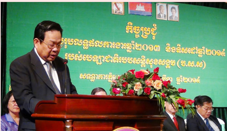
ឯកឧត្តមបណ្ឌិត អ៊ិត សំហេង រដ្ឋមន្ត្រីក្រសួងការងារ អញ្ជើញឡើងថ្លែងសុន្ទរកថា និងផ្តល់អនុសាសន៍ណែនាំក្នុងអង្គពិធី

របស់បេឡាជាតិរបបសន្តិសុខសង្គម ជាច្រើនរូប។