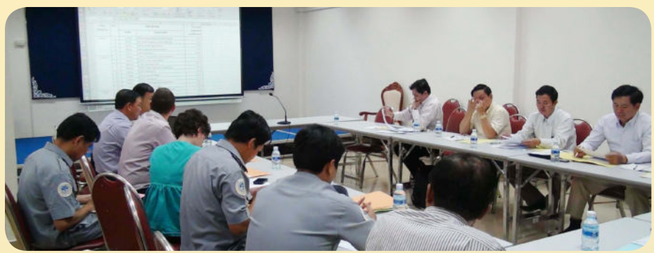
ទិដ្ឋភាពនៃការកែប្រែឧបសម្ព័ន្ធ១ នៃប្រកាស

ការប្រជុំពិភាក្សានេះដែរ អង្គប្រជុំមានគោលដៅបង្កើតចេញនូវប្រកាសពេញលេញមួយ និងជាលក្ខណៈរួមមួយផ្សេងទៀត ដើម្បីឱ្យមានការឯកភាពគ្នា ហើយធ្វើការអនុវត្តចំពោះការទូទាត់ផ្ទៃសេវាសាធារណៈ ឱ្យមានភាពងាយស្រួល ប្រសិទ្ធភាព និងតម្លាភាព។