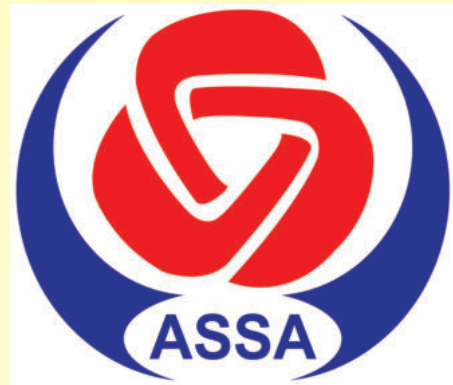
ASEAN SOCIAL SECURITY ASSOCIATION

កាលពីថ្ងៃទី២៩ ខែតុលា ឆ្នាំ២០១៣ តបតាមការអញ្ជើញ របស់ប្រធានអង្គភាពសន្តិសុខសង្គម នៃប្រទេសឡាវ លោក អ៊ុក សមវិទ្យា នាយកបេឡាជាតិរបបសន្តិសុខសង្គម អមដោយ លោក លោកស្រី ជាប្រធាន អនុប្រធាន ការិយាល័យ បានអញ្ជើញទៅចូលរួមកិច្ចប្រជុំនៃសមាគមសន្តិសុខសង្គមអាស៊ាន (ASSA) លើកទី៣០ នៅទីក្រុងវៀងច័ន្ទ សាធារណរដ្ឋប្រជាធិបតេយ្យប្រជាមានិតឡាវ ដែលប្រព្រឹត្តទៅចាប់ពីថ្ងៃទី២៩ ខែតុលា ដល់ថ្ងៃទី០២ ខែវិច្ឆិកា ឆ្នាំ ២០១៣។