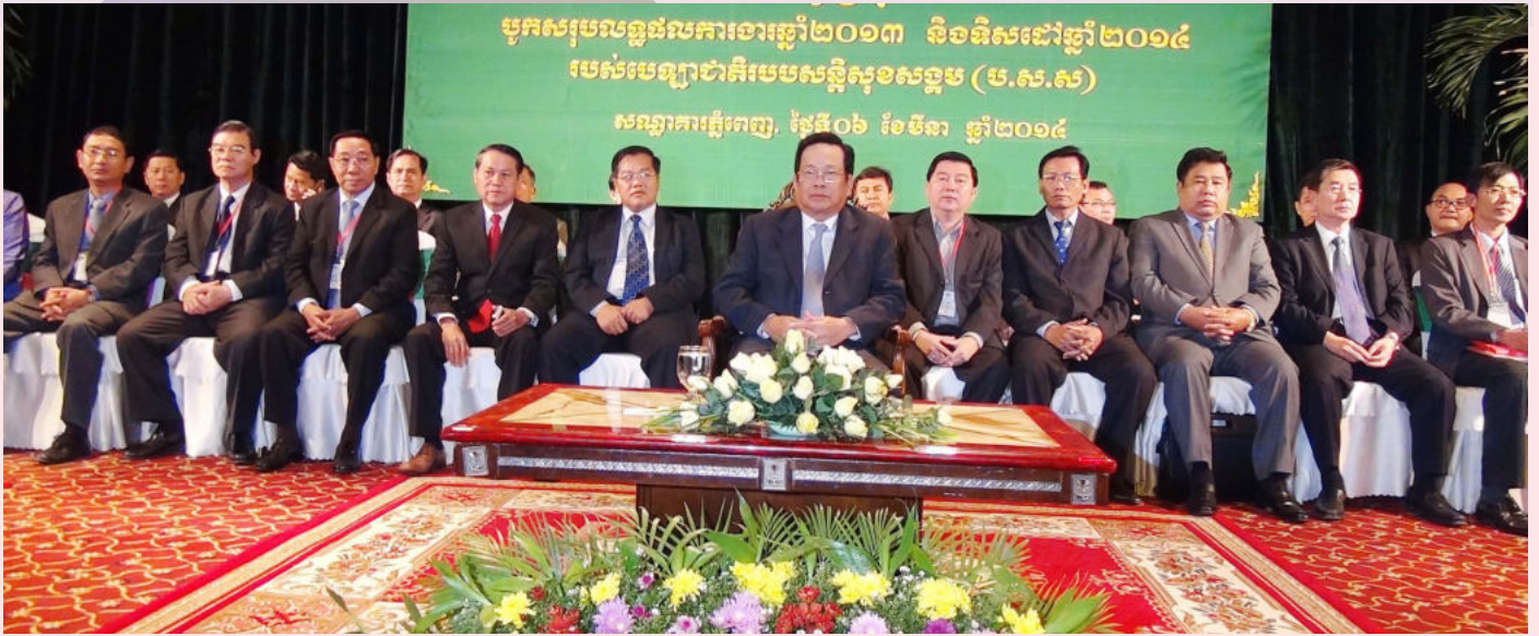
ទិដ្ឋភាពគណៈអធិបតីក្នុងអង្គពិធីក្រោមអធិបតីភាពដ៏ខ្ពង់ខ្ពស់ ឯកឧត្តមបណ្ឌិត អ៊ិត សំហេង រដ្ឋមន្ត្រីក្រសួងការងារ និងបណ្តុះបណ្តាលវិជ្ជាជីវៈ