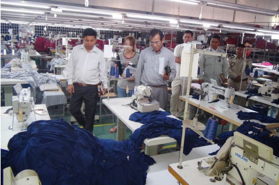
សកម្មភាពចុះពិនិត្យមើលកន្លែងការងាររបស់កម្មករនិយោជិតឱ្យត្រឹមត្រូវតាមលក្ខខណ្ឌបច្ចេកទេស

គណៈកម្មការ ស.ទ.ប.ក បានចុះពិនិត្យដល់គ្លីនិកឯកជន និងមណ្ឌលសុខភាព ដើម្បីសាកសួរពីស្ថានភាព អ្នកជំងឺដែលបានសន្តប។ ចំពោះរាល់ការចំណាយទៅលើថ្លៃព្យាបាល គឺបេឡាជាតិរបបសន្តិសុខសង្គម ជាអ្នកធានារ៉ាប់រងទាំងស្រុង។