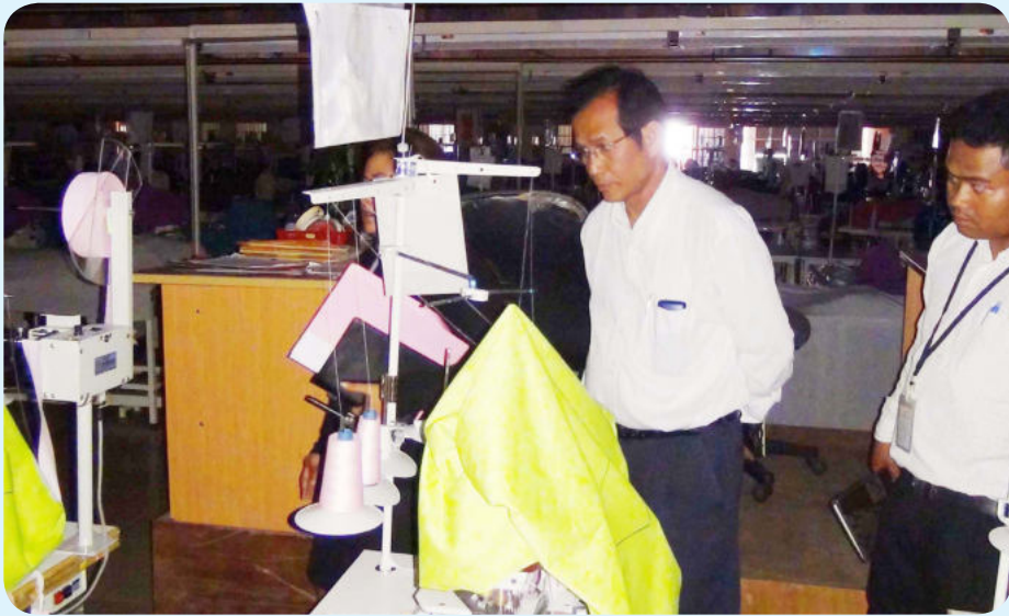
ការចុះត្រួតពិនិត្យរបស់គណៈកម្មការនៅកន្លែងការងាររបស់ជនរងគ្រោះ

និយោជិត បានសម្រាកព្យាបាលនៅទីនោះផងដែរ។ ចំពោះរាល់ការចំណាយទៅលើថ្លៃព្យាបាលគឺបេឡាជាតិរបបសន្តិសុខសង្គម ជាអ្នករ៉ាប់រងទាំងស្រុង។ ក្នុងករណីនេះហើយ ធ្វើឱ្យក្រសួងការងារ និងបណ្តុះបណ្តាលវិជ្ជាជីវៈ ដែលមានបេឡាជាតិរបបសន្តិសុខសង្គម ចំណាយទាំងថវិការ និងពេលវេលាទៅលើការចុះផ្សព្វផ្សាយអប់រំណែនាំទៅរដ្ឋបាល ទៅដល់ពេទ្យប្រចាំរោងចក្រ និងកម្មករនិយោជិត ឱ្យយល់ច្បាស់និងជ្រួតជ្រាប អំពីការទប់ស្កាត់ និងការការពារ ដើម្បីកាត់បន្ថយករណីដួលសន្លប់ នៅតាមរោងចក្រ សហគ្រាស ឱ្យស្ថិតនៅកម្រិតទាបបំផុត។