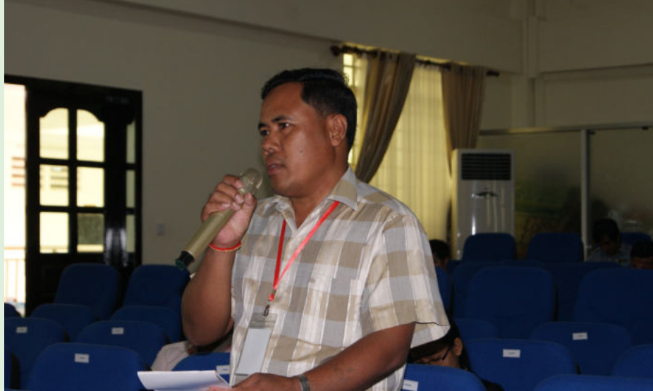
វេទិកាសំណួរ-ចម្លើយរបស់អ្នកចូលរួមក្នុងអង្គពិធី

ក្រៅពីនេះគណៈកម្មការ បានសិក្សាស្រាវជ្រាវរកមូលហេតុ ដែលបណ្តាលឱ្យដួលសន្លប់ និយាយជារួម, និងនិយាយដោយឡែក បានរៀបចំផ្សព្វផ្សាយអប់រំ តាមរោងចក្រសហគ្រាស គ្រឹះស្ថាន ជាគោលដៅសំខាន់ និងរៀបចំឯកសារពាក់ព័ន្ធ សម្រាប់ផ្សព្វផ្សាយ ឱ្យកាន់តែទូលំទូលាយបន្ថែម ដល់បងប្អូនកម្មករ កម្មការិនីឱ្យមានការយល់ដឹង និងមានការទទួលខុសត្រូវខ្ពស់។