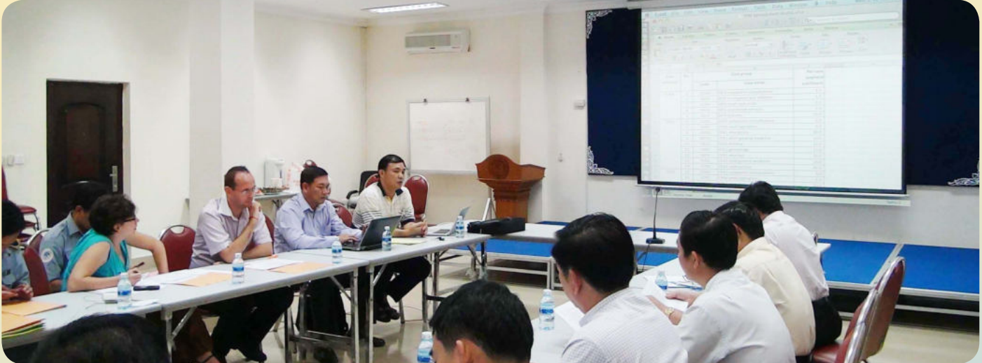
សកម្មភាពចូលរួមពិភាក្សាកែសម្រួលឧបសម្ព័ន្ធ២ នៃប្រកាស