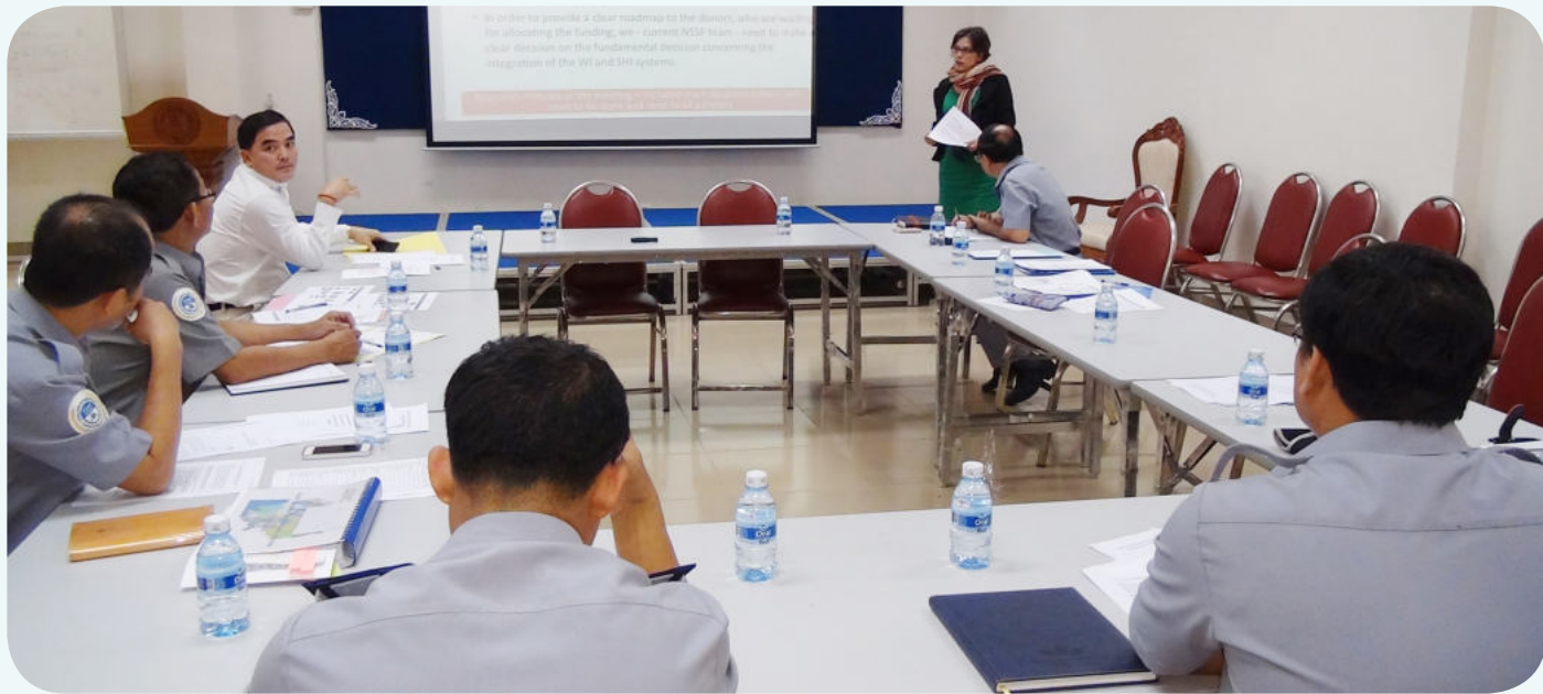
ការចូលរួមបង្ហាញ នូវបទពិសោធន៍ផ្សេងៗ របស់តំណាងអង្គការ ILO

ការផ្តល់មតិ និងចូលរួមយោបល់របស់អង្គការពាក់ព័ន្ធប្រតិបត្តិការណ៍នេះ គឺទាមទារឱ្យដៃគូពាក់ព័ន្ធសហការគ្នាឱ្យបានម៉ត់ចត់ ផ្តល់បទពិសោធន៍ឱ្យគ្នាទៅវិញទៅមកដើម្បីងាយស្រួលគ្រប់គ្រង និងអនុវត្តការងារឱ្យបានល្អ មានប្រសិទ្ធភាព និងតម្លាភាព។