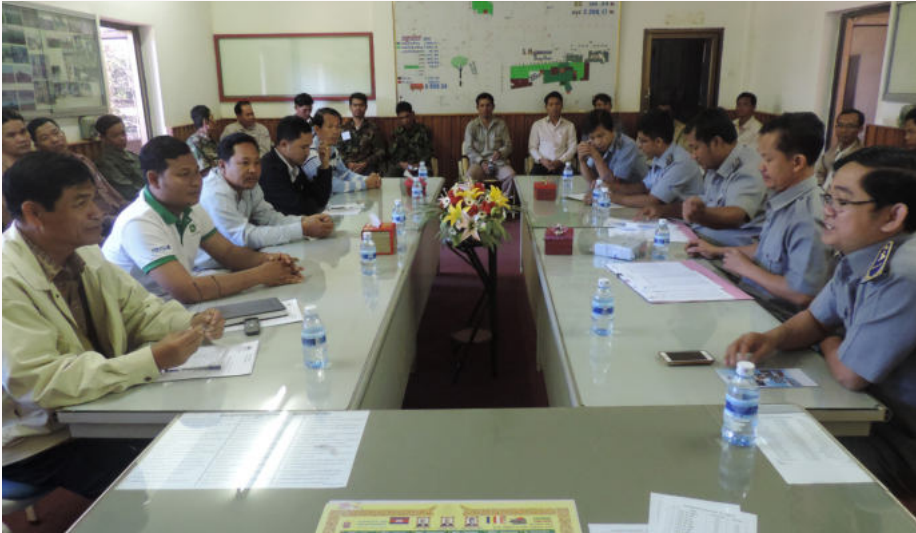
ការពិភាក្សាពិគ្រោះយោបល់ និងសុំកិច្ចសហការជាមួយរដ្ឋបាលនៅរោងចក្រ និងផ្នែកពាក់ព័ន្ធដទៃទៀត

បេឡាជាតិរបបសន្តិសុខសង្គម បានអនុវត្តនូវរបបធានារ៉ាប់រងហានិភ័យការងារ របស់ខ្លួន (គ្រោះថ្នាក់ការងារ) ដល់បងប្អូនកម្មករនិយោជិត ដែលបម្រើការងារ តាមបណ្តាសហគ្រាស គ្រឹះស្ថាន ដែលប្រើប្រាស់កម្មករនិយោជិតចាប់ពី៨នាក់ឡើងទៅ។ ជាជំហានដំបូងនៃការធានារ៉ាប់រងនេះ កន្លងមក ប.ស.ស បានទទួលឯកសារ និងទិន្នន័យមិនបានគ្រប់ជ្រុងជ្រោយ ដើម្បីជាមូលដ្ឋានក្នុងការ បង្កើតអត្តសញ្ញាណ (កាតសមាជិក)។ ដោយសារទិន្នន័យនៃការចុះបញ្ជីឈ្មោះកម្មកររបស់ សហគ្រាស គ្រឹះស្ថាន មួយចំនួនមានលក្ខណៈខុសពីប្រក្រតី (កម្មករនិយោជិតមានឈ្មោះជាន់គ្នា និងបានប្រើប្រាស់ឯកសារខ្លីគ្នាទៅវិញទៅមកដែលធ្វើឱ្យ ប.ស.ស ពិបាកគ្រប់គ្រងទិន្នន័យ។ ក្នុងខណៈនោះដែរ ប.ស.ស បានធ្វើការកែតម្រូវឱ្យកម្មករនិយោជិត ប្រើប្រាស់ឯកសារចូលបម្រើការងារ ឱ្យបានត្រឹមត្រូវ តាមច្បាប់ ដើម្បីមានភាពងាយស្រួលក្នុងការគ្រប់គ្រងព័ត៌មាន។ បច្ចុប្បន្ននេះ បេឡាជាតិរបបសន្តិសុខសង្គម បាននឹងកំពុងធ្វើប័ណ្ណធានារ៉ាប់រងហានិភ័យការងារ ដើម្បីចែកជូនដល់កម្មករ