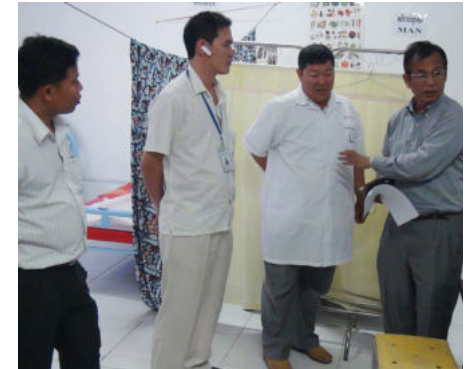
ការចុះពិនិត្យ និងណែនាំរបស់គណៈកម្មការ

ពីមួយនាក់ ឬពីរនាក់ ហើយរហូតដល់ មានការភ្ញាក់ផ្អើលដួលសន្តបតៗគ្នាជាច្រើននាក់។ បន្ទាប់ពីដួលសន្តបរបស់កម្មករកម្មការិនីរួចមក រោងចក្របានសហការ ជាមួយអង្គការពាក់ព័ន្ធនិង ប.ស.ស បានបញ្ជូនជនរងគ្រោះទៅកាន់