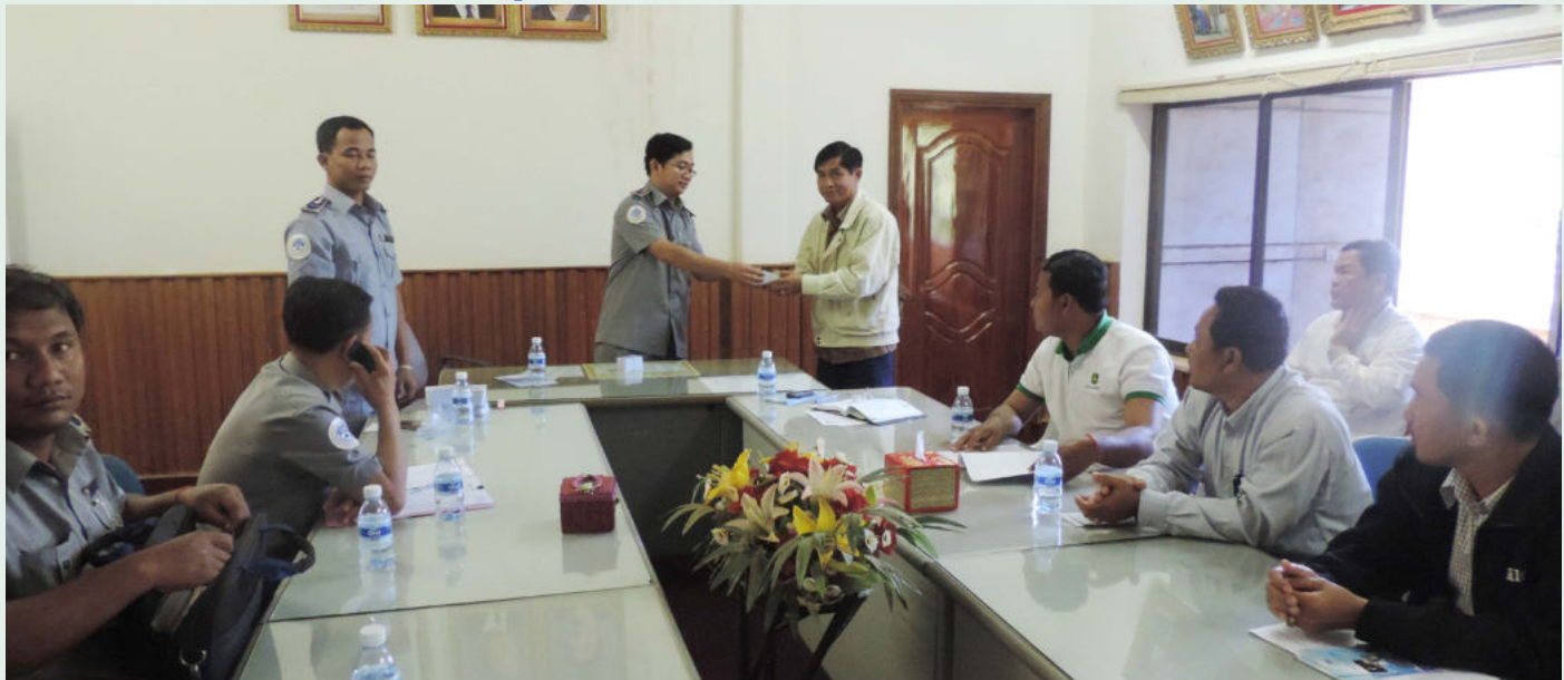
ទិដ្ឋភាពប្រគល់កាតសមាជិកថ្មី ដល់រដ្ឋបាលរាងចក្រ សម្រាប់ចែកជូនបន្តដល់សមាជិកចូលថ្មី