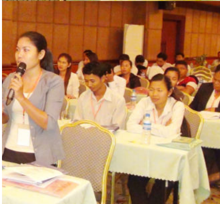
ការចោទសួរសំណួរ របស់សមាជិកចូលរួមក្នុងអង្គពិធី

អង្គសន្និបាត ប.ស.ស បានប្រារព្ធឡើងដើម្បីធ្វើការសរុបលទ្ធផលការងារ ដែលបានអនុវត្តជិតមួយឆ្នាំកន្លងមក ដោយធ្វើការវាស់វែងស្ថាប័នក្នុងការវាស់កម្រិតការងារ និងធ្វើការសន្និដ្ឋានរួមមួយ ដើម្បីស្វែងរកចំណុចប្រឈមណាមួយ ដើម្បីធ្វើការដោះស្រាយ ឲ្យទាន់ពេលទៅតាមតម្រូវការ របស់ដៃគូពាក់ព័ន្ធ ជាពិសេសកំណត់ទិសដៅអនុវត្តការងារបន្ត ដោយប្រតិបត្តិការងារ ដែលនៅសេសសល់ ក្នុងនោះមានការប្រឈមខ្លះដែលត្រូវដោះស្រាយជាបន្ទាន់។