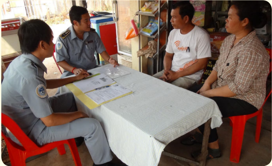
ការចុះសួរព័ត៌មាន និងផ្តល់អត្ថប្រយោជន៍ដល់ក្រុមគ្រួសារជនរងគ្រោះ

បានត្រឹមតែទូទាត់ថ្លៃឈ្នួល ដឹកជញ្ជូនសពមក ផ្ទះ និងផ្តល់ប្រាក់វិភាជន៍បូជាសពចំនួន៤,០០០ ,០០០រៀល តែប៉ុណ្ណោះ ដើម្បីធ្វើបុណ្យតាម ប្រពៃណី។