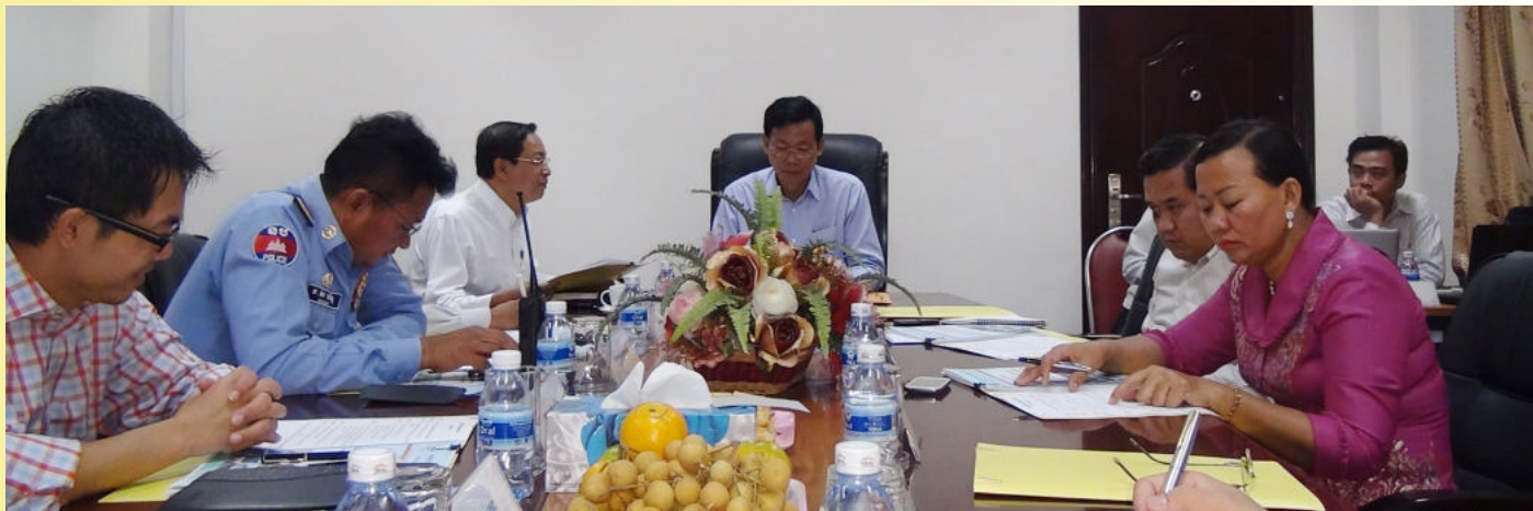
សមាសភាពក្រុមការងារ ស.ផ.ក ក្នុងកិច្ចប្រជុំពិភាក្សា

យើងសង្កេតឃើញហើយថា គ្រោះថ្នាក់ចរាចរណ៍ នៅកម្ពុជាសព្វថ្ងៃកើតឡើងគ្រប់សណ្ឋាន និងគ្រប់ប្រភេទ ដែលជាបញ្ហាមួយគួរឱ្យចាប់អារម្មណ៍យ៉ាងខ្លាំងក្នុងរយៈពេលកន្លងមកនេះ។ គ្រោះថ្នាក់ចរាចរណ៍ជាយោគលាក់មុខ ដែលធ្វើឱ្យមនុស្សរាប់សិបនាក់រងរបួស និងស្លាប់យ៉ាងអាណាចអាជ័យ។ ទន្ទឹមនឹងនោះដែរ រាជរដ្ឋាភិបាលនៃព្រះរាជាណាចក្រកម្ពុជា ក៏ដូចជាក្រសួងការងារ និងបណ្តុះបណ្តាលវិជ្ជាជីវៈ បានយកចិត្តទុកដាក់ក្នុងការទប់ស្កាត់ មិនឱ្យ