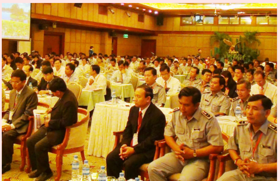
ការចូលរួមរបស់ថ្នាក់ដឹកនាំ ប.ស.ស, មន្ត្រី ប.ស.ស ខេត្ត និងអង្គភាពពាក់ព័ន្ធ

កាលពីថ្ងៃទី០៦ ខែមីនា ឆ្នាំ២០១៤វេលាម៉ោង ៩:០០នាទីព្រឹក នៅសណ្ឋាគារភ្នំពេញ មានបើកពិធីបូកសរុបលទ្ធផលការងារឆ្នាំ២០១៣ និងទិសដៅឆ្នាំ២០១៤ របស់បេឡាជាតិរបបសន្តិសុខសង្គម នៃក្រសួងការងារ និងបណ្តុះបណ្តាលវិជ្ជាជីវៈ ក្រោមអធិបតីភាពដ៏ខ្ពង់ខ្ពស់ ឯកឧត្តមបណ្ឌិត អ៊ិត សំហេង រដ្ឋមន្ត្រីក្រសួងការងារ និងបណ្តុះបណ្តាលវិជ្ជាជីវៈ ឯកឧត្តមរដ្ឋលេខាធិការ អនុរដ្ឋលេខាធិការ មន្ត្រីរាជការ ក្រោមឱវាទក្រសួង/ស្ថាប័ន ពាក់ព័ន្ធ ភ្ញៀវជាតិ និងអន្តរជាតិ ព្រមទាំងថ្នាក់ដឹកនាំមន្ត្រីបុគ្គលិក