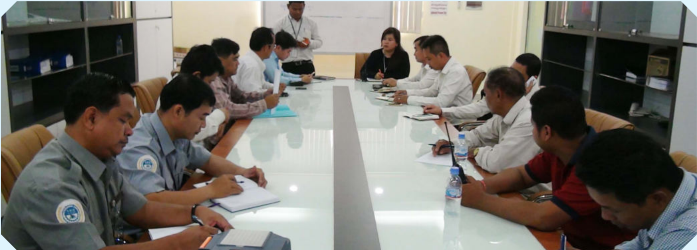
ការប្រជុំពិគ្រោះយោបល់ និងស្រាវជ្រាវរកមូលហេតុដែលបណ្តាលឱ្យដួលសន្លប់

កាលពីថ្ងៃទី១៤ ខែមីនា ឆ្នាំ២០១៤ វេលាម៉ោង ៩:៤០នាទីព្រឹក គណៈកម្មការសិក្សាស្រាវជ្រាវទប់ស្កាត់ករណីសន្លប់ និងបង្ការគ្រោះថ្នាក់ការងារ(ស.ទ.ប.ក)បានចុះអង្កេតករណីកម្មករនិយោជិតដួលសន្លប់ ដែលកើតមានឡើងនៅរោងចក្រ CAMBO KOTOP LTD មានកម្មករនីមួយៗ ៥៤នាក់ បានដួលសន្លប់ក្នុងចំណោមកម្មករនិយោជិតចំនួន ២,៥៤៦នាក់ ស្រី២,៤១១នាក់ បរទេស ៣៨នាក់។ ករណីដួលសន្លប់នេះបានកើតឡើងនៅថ្ងៃទី ១៣ ខែមីនា ឆ្នាំ២០១៤ វេលាម៉ោង ៤:០៥នាទីរសៀល ចំនួន ១៦នាក់ និងថ្ងៃទី១៤ ខែមីនា ឆ្នាំ២០១៤ វេលាម៉ោង ៧:៤០នាទីព្រឹក ចំនួន៣៨នាក់។ បើតាមការសន្និដ្ឋានរបស់គណៈកម្មការ ស.ទ.ប.ក មូលហេតុដែលកម្មករនិយោជិតដួលសន្លប់ គឺ