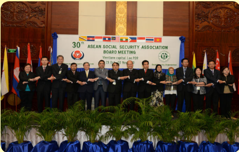
រូបថតអនុស្សាវរីយ៍ តំណាងគណៈប្រតិភូអាស៊ាន