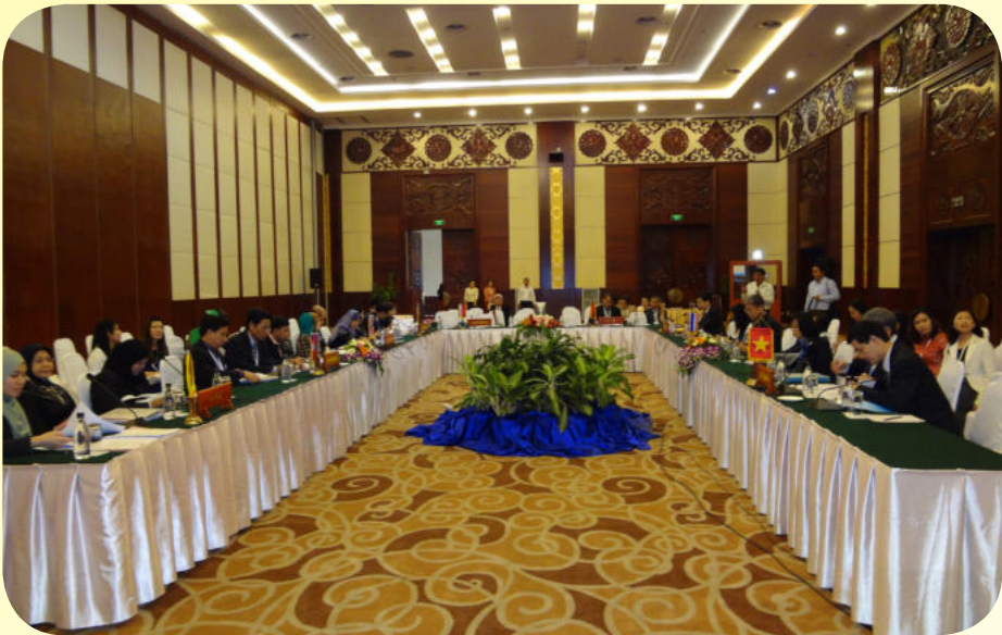
ប្រតិភូតំណាងប្រទេសជាសមាជិក នៃសមាគមសន្តិសុខសង្គមអាស៊ាន ក្នុងពិធីបើកអង្គប្រជុំ