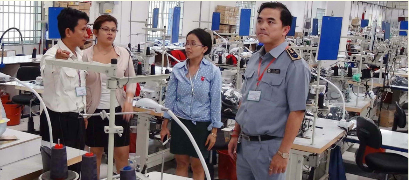
ការត្រួតពិនិត្យលក្ខខណ្ឌការងារ នៅរោងចក្រ (Cristal Martin)

រហូតមកដល់ថ្ងៃទី២៨ ខែកុម្ភៈ ឆ្នាំ២០១៤ កម្មការិនីបានធ្ងរស្បើយ និងបានត្រលប់ទៅធ្វើ ការវិញជាធម្មតា ហើយមានមួយចំនួនស្ថិតនៅ ក្នុងមន្ទីរពេទ្យនៅឡើយ ក្រោមការព្យាបាល យ៉ាងយកចិត្តទុកដាក់ពីគ្រូពេទ្យ។ រាល់ការចំណាយ លើការព្យាបាលទាំងអស់ជា បន្ទុករបស់ ប.ស.ស ទាំងស្រុង។