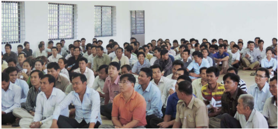
ការចូលរួមស្តាប់ នូវការណែនាំ របស់មន្ត្រី ប.ស.ស ដល់អ្នកទទួលបញ្ជីសមាជិកថ្មី

និយោជិត ដើម្បីមានភាពងាយស្រួលក្នុងការសម្គាល់ថា ជាសមាជិកបេឡាជាតិរបបសន្តិសុខសង្គម។ ស្របនឹងនេះដែរ កាលពីថ្ងៃទី០២ រហូតដល់ ថ្ងៃទី០៥ ខែធ្នូ ឆ្នាំ២០១៣ មន្ត្រី