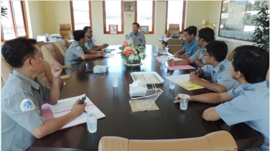
ការចូលរួមផ្តល់យោបល់ របស់តំណាងរាងចក្រ សហគ្រាស

- សហគ្រាស AN MADY GROUP CO.,LTD នៅឃុំចំការអណ្តូង ស្រុកចំការលើ ខេត្តកំពង់ចាម មានកម្មករសរុបចំនួន ១៣៩នាក់ កម្មករនិយោជិត ទទួលបានប័ណ្ណចំនួន ៥៦៤នាក់។