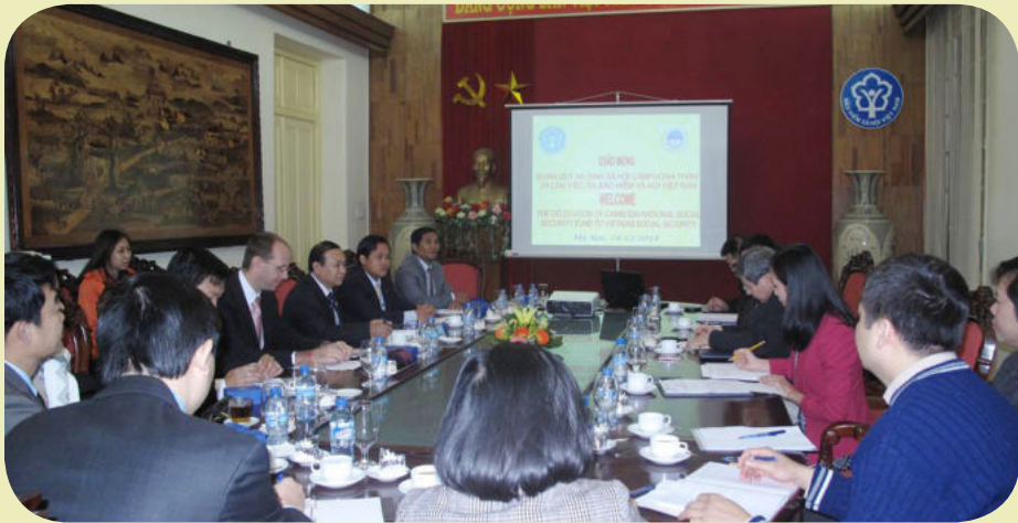
ទិដ្ឋភាពរួមនៃកិច្ចពិភាក្សារបស់ក្រុមការងារ

ក្រៅពីរបបធានារ៉ាប់រងហានិភ័យការងារ ប.ស.ស បានគ្រោងដាក់ឱ្យដំណើរការរបបថែទាំសុខភាព ដោយបានធ្វើការស្រាវជ្រាវសង្កេតជាបទដ្ឋានគតិយុត្តម្យយចំនួន និងមានការសហការ ជួយជ្រោមជ្រែង ពីសំណាក់ក្រសួង/ស្ថាប័ន អង្គការពាក់ព័ន្ធ អង្គការជាតិ និងអន្តរជាតិជាច្រើនផ្សេងទៀត។