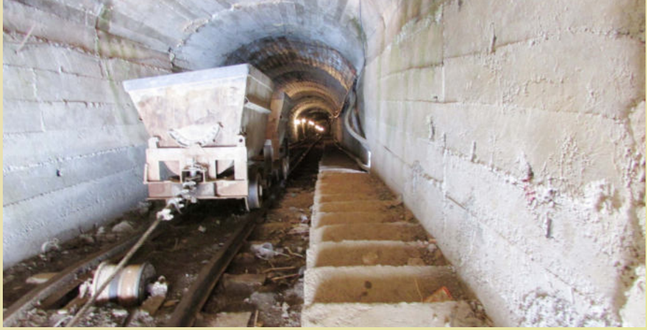
ការរដ្ឋានអណ្តូងរ៉ែ (ខេត្តក្រចេះ)

ត្រួតពិនិត្យលក្ខខណ្ឌការងារ នៅក្រុមហ៊ុនវ៉ែស៊ីងយន្តគ័ង ខូអិលធីឌី ហើយបានធ្វើការពន្យល់ណែនាំដល់តំណាងក្រុមហ៊ុនឱ្យគោរពច្បាប់ការងារ និងច្បាប់ការងាររបស់ ប.ស.ស ដោយឱ្យតំណាងក្រុមហ៊ុន ធ្វើការអប់រំណែនាំដល់កម្មករនិយោជិតរបស់ខ្លួនឱ្យចេះវិន័យវិធីសាស្ត្រ ក្នុងការទប់ស្កាត់ និងបង្ការគ្រោះថ្នាក់ផ្សេងៗដែលកើតឡើងជាថាហេតុ ហើយឱ្យមានការគោរពវិន័យការងារបានល្អ អនាម័យល្អ និងឱ្យមានការរស់នៅស្អាតផងដែរ។