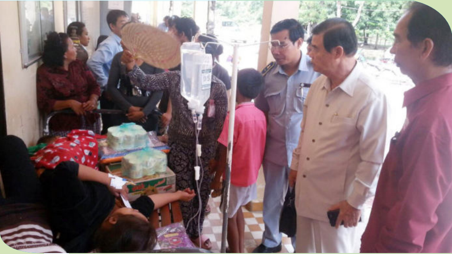
ការត្រួតពិនិត្យ និងណែនាំដល់និយោជក និងកម្មករនិយោជិត ដើម្បីអនុវត្ត

សំណង់រោងចក្រទាំងអស់មុននឹងអនុញ្ញាតឲ្យកម្មករនិយោជិតចូលធ្វើការវិញ។