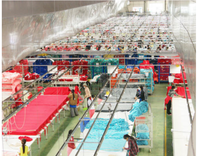
ទិដ្ឋភាពរបស់គណៈកម្មការចុះទៅពិនិត្យកន្លែងធ្វើការរបស់កម្មករនិយោជិត