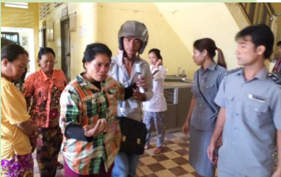
ការចុះជួយសម្របសម្រួលរបស់មន្ត្រី ប.ស.ស នៅមន្ទីរពេទ្យបង្អែកស្រុកជើងព្រៃ

ការបញ្ជូនជនរងគ្រោះទៅមន្ទីរពេទ្យបង្អែក ស្រុកជើងព្រៃ ខេត្តកំពង់ចាម។ ករណី គ្រោះថ្នាក់នេះ ក្រុមការងារបានវាយតម្លៃ ថាជាគ្រោះថ្នាក់ការងារ ហើយរាល់ការ ចំណាយ ចំពោះការដឹកជញ្ជូនជនរងគ្រោះ និងការព្យាបាលជាបន្ទុក របស់បេឡាជាតិ របបសន្តិសុខសង្គម។