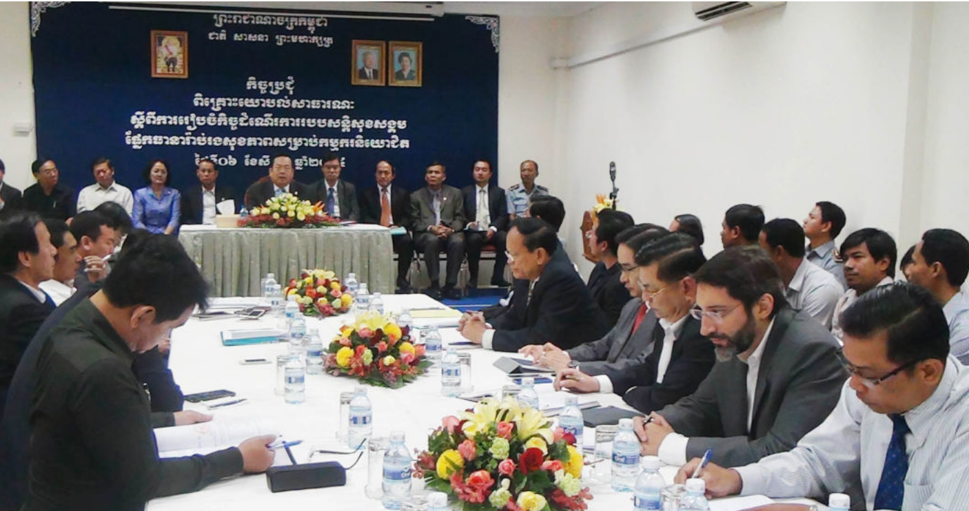
ទិដ្ឋភាពបើកកិច្ចប្រជុំពិគ្រោះយោបល់សាធារណៈស្តីពីការរៀបចំកិច្ចដំណើរការរបបសន្តិសុខសង្គម ផ្នែកធានារ៉ាប់រងសុខភាព សម្រាប់កម្មករនិយោជិត