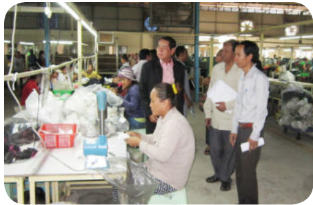
ការអញ្ជើញចុះអប់រំណែនាំផ្ទាល់ របស់ក្រុមការងារ