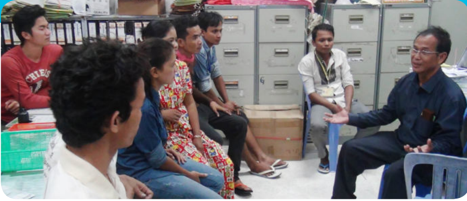
កិច្ចពិភាក្សាទាញរកមូលហេតុដែលធ្វើឲ្យមានករណីសន្លប់

ដើម្បីបង្ហាញ និងកាត់បន្ថយករណីសន្លប់ ដែលកើតមាន ចំពោះកម្មករនិយោជិត ក្រសួងការងារ និងបណ្តុះបណ្តាលវិជ្ជាជីវៈ បានបង្កើតគណៈកម្មការសិក្សាស្រាវជ្រាវ និង ទប់ស្កាត់ករណីសន្លប់របស់កម្មករនិយោជិត តាមសហគ្រាសគ្រឹះស្ថានដែលមានភារកិច្ច ដូចខាងក្រោម៖ សិក្សាស្រាវជ្រាវ និងពិនិត្យ រកមូលហេតុសន្លប់, ចាត់វិធានការសង្គ្រោះ បន្ទាន់ និងទប់ស្កាត់ការសន្លប់របស់កម្មករ និយោជិតនៅកន្លែងការងារ, សម្រប សម្រួល និងសហការជាមួយមន្ទីរពេទ្យ ពហុព្យាបាល ដើម្បីបង្កើតរូបមន្តព្យាបាល សន្លប់ និងកំណត់ពីតម្លៃព្យាបាល, សម្រប សម្រួល សហការជាមួយស្ថាប័ន និងអាជ្ញា ធរណាមួយ ដើម្បីដឹកជញ្ជូនជនរងគ្រោះទៅ សង្គ្រោះបន្ទាន់នៅមន្ទីរពេទ្យពហុព្យាបាល ប្រកបដោយសុវត្ថិភាព, និងទាន់ពេល វេលា ជាពិសេសធ្វើការរៀបចំណែនាំ និង