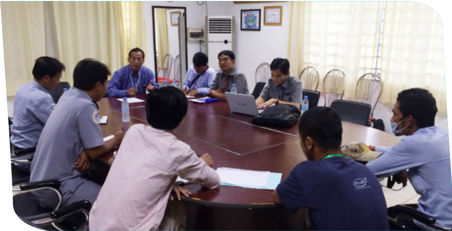
កិច្ចពិភាក្សារកម្មលហេតុដែលបណ្តាលឲ្យកើតបញ្ហានៅក្នុងរោងចក្រ