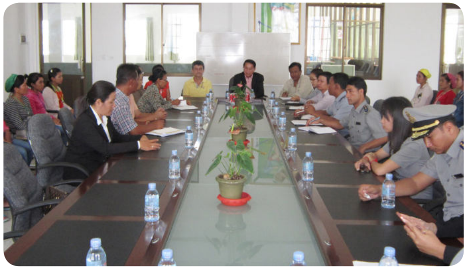
ទិដ្ឋភាពប្រជុំអប់រំណែនាំរបស់ក្រុមប្រឹក្សាបច្ចេកទេស (ក.ប.ស.ស.)

កាលពីថ្ងៃទី០៧-០៩ ខែកក្កដា ឆ្នាំ ២០១៤ ឯកឧត្តម កាន់ ម៉ែន រដ្ឋលេខាធិការ ក្រសួងការងារ និងបណ្តុះបណ្តាលវិជ្ជាជីវៈ និងជាប្រធាន ក្រុមប្រឹក្សាបច្ចេកទេសរបបសន្តិសុខសង្គម (ក.ប.ស.ស.) បានដឹកនាំក្រុមប្រឹក្សាបច្ចេកទេស ក.ប.ស.ស. សម្រាប់ជនទាំងឡាយ ដែលស្ថិតនៅក្រោមបទប្បញ្ញត្តិនៃច្បាប់ ស្តីពីការងារចុះប្រជុំផ្សព្វផ្សាយអប់រំ ពីការបង្កាច់វិជ្ជាជីវៈ លក្ខខណ្ឌការងារ, លក្ខខណ្ឌអនាម័យ ដល់