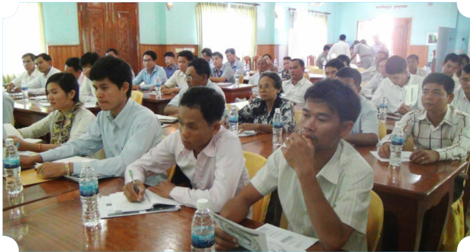
ការអញ្ជើញចូលរួមរបស់សិក្ខាកាមក្នុងអង្គពិធី

ជានិយោជក នាយក ម្ចាស់ ឬតំណាង សហគ្រាស គ្រឹះស្ថាន ជនរងគ្រោះ និងអ្នក នៅក្នុងបន្ទុកផ្ទាល់នៃជនរងគ្រោះ។ កិច្ច ប្រជុំផ្សព្វផ្សាយនេះ បានបញ្ជាក់អំពីចំណុច សំខាន់ នៃអង្គសិក្ខាសាលា ដែលផ្តោតទៅ លើការផ្តល់ព័ត៌មានពីចំនួនកម្មករនិយោជិត មិនគ្រប់ ឬរាយការណ៍ប្រាក់ឈ្នួលជាប់ភាគ ទានមិនបានត្រឹមត្រូវមកកាន់ ប.ស.ស, ការចុះធ្វើ ការត្រួតពិនិត្យក្នុងសហគ្រាស គ្រឹះស្ថាន នៃក្រុមអធិការកិច្ចនៃ ប.ស.ស, សារៈសំខាន់ នៃការចុះសំបុត្រអាពាហ៍ ពិពាហ៍ និងសំបុត្រកំណើតឬអត្រានុកូល ផ្ទាល់ របស់កម្មករនិយោជិត, ការផ្តល់តាវ កាលិកហានិភ័យការងារ ការចុះបញ្ជីកា