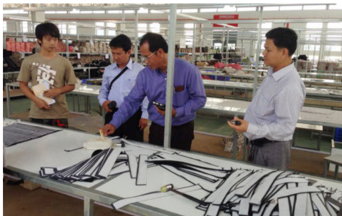
ការចុះត្រួតពិនិត្យទីកន្លែងធ្វើការកម្មករនិយោជិតរបស់ក្រុមការងារ