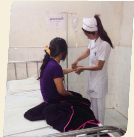
ការពិនិត្យព្យាបាលរបស់គ្រូពេទ្យ

ចំនួន៤២នាក់។ ចំពោះករណីនេះ គណៈ កម្មការ បានចុះពិនិត្យអង្កេតសាកសួររក មូលហេតុនៅក្នុងរោងចក្រ និងចុះទៅគ្លីនិក មូលមិត្ត ដើម្បីពិនិត្យស្ថានភាពសុខភាព