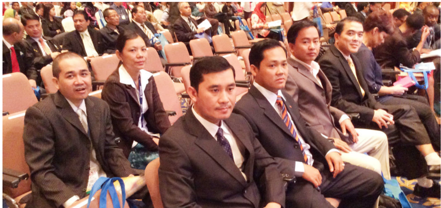
ទិដ្ឋភាពចូលរួមរបស់មន្ត្រី ប.ស.ស និងមន្ត្រីក្រសួងពាក់ព័ន្ធក្នុងអង្គពិធី

កំណើនសេដ្ឋកិច្ចសង្គមឡើងវិញ ក្នុងការកាត់បន្ថយភាពក្រីក្រ។