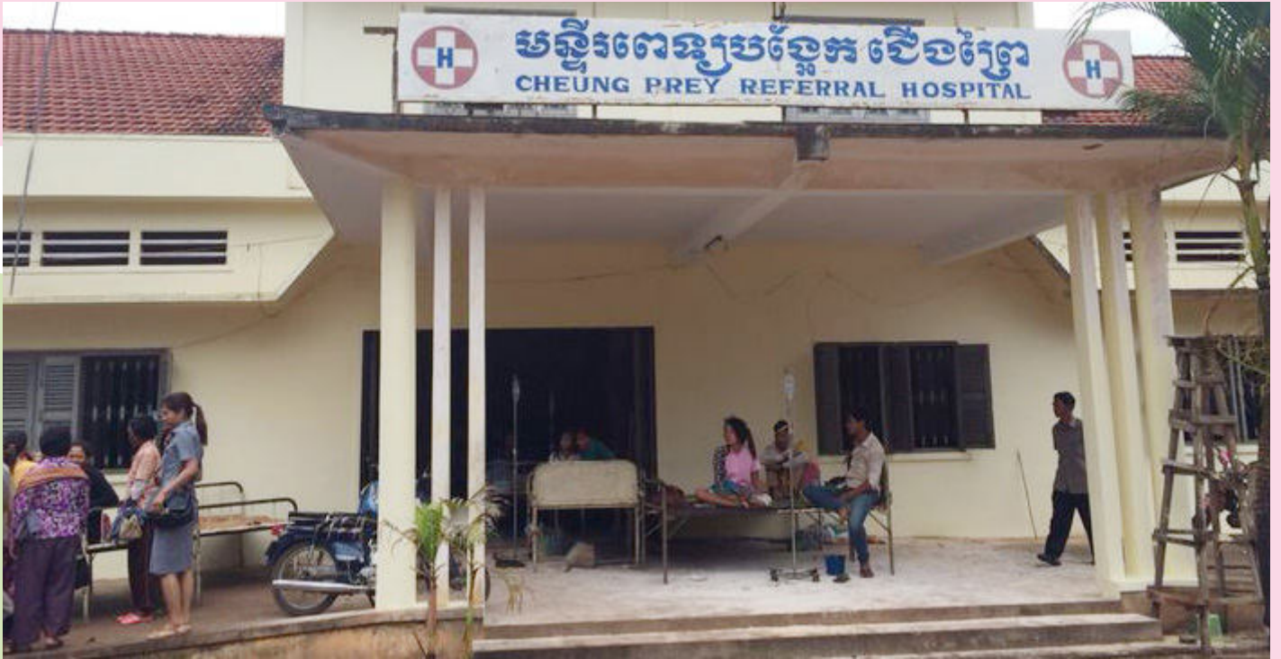
ទិដ្ឋភាពព្យាបាលជនរងគ្រោះនៅមន្ទីរពេទ្យ

កាលពីវេលាម៉ោង ៦:៣០ នាទីព្រឹក ថ្ងៃទី២៣ ខែមិថុនា ឆ្នាំ២០១៤ នៅភូមិ ល្បៀង ឃុំផ្តល់ដំបង ស្រុកជើងព្រៃ ខេត្ត កំពង់ចាម មានករណីគ្រោះថ្នាក់ចរាចរណ៍ កើតឡើងមួយដោយសាររថយន្ត ១គ្រឿង ដឹកកម្មការិនី ដែលធ្វើការនៅរោងចក្រ CARLING TON (CAMBODIA) Co., Ltd មានទីតាំង ស្ថិតនៅស្រុកជើងព្រៃ ខេត្ត