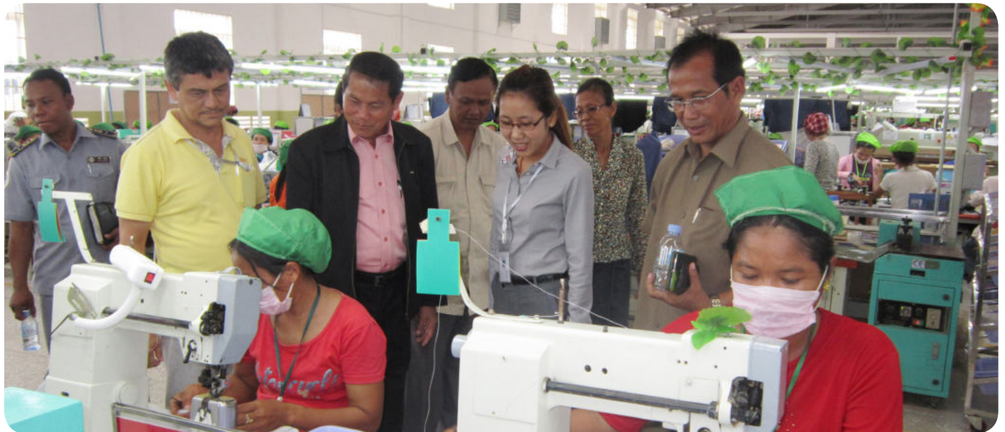
ការអញ្ជើញចុះត្រួតពិនិត្យរបស់ក្រុមការងារ ដល់កន្លែងធ្វើការរបស់កម្មករនិយោជិត

សុខភាព និងរបបប្រាក់សោធនដែលត្រូវអនុវត្ត ចំពោះកម្មករនិយោជិត នាពេលខាងមុខ។ ឯកឧត្តម ប្រធានក្រុមប្រឹក្សាបច្ចេកទេស ក.ប.ស.ស. បានធ្វើការណែនាំផងដែរ ដល់និយោជកឲ្យផ្សព្វផ្សាយបន្តអំពីវិធីសាស្ត្រមួយចំនួនក្នុងការបង្កា ដើម្បីឲ្យកម្មករនិយោជិតជៀសផុតពីជំងឺវិជ្ជាជីវៈ និងគ្រោះថ្នាក់ផ្សេងៗដែលកើតមាន ឡើងដោយសារការងារ។