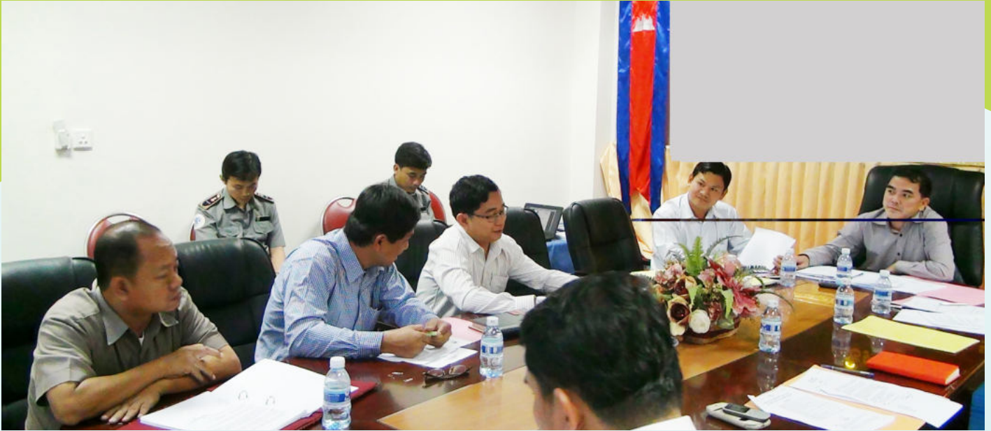
ការប្រជុំពិភាក្សារបស់គណៈកម្មការ

គណៈកម្មការដោះស្រាយវិវាទ ឬបណ្តឹងនៃ ប.ស.ស បង្កើតឡើងដើម្បីដោះស្រាយវិវាទ ឬបណ្តឹង ដែលទាក់ទងទៅនឹងការអនុវត្តបទប្បញ្ញត្តិ និងបទបញ្ជាខាងវិស័យសន្តិសុខសង្គម រវាងសមាជិក ប.ស.ស និយោជក និងបេឡាជាតិរបបសន្តិសុខសង្គម។ គណៈកម្មការដោះស្រាយវិវាទ ឬ