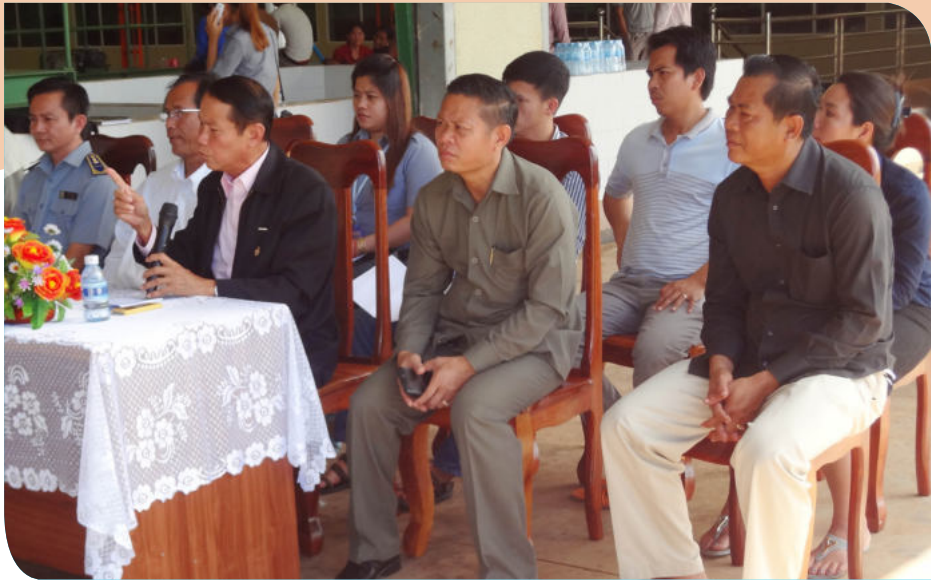
ទិដ្ឋភាពចូលរួមរបស់និយោជក ឬតំណាង និងអង្គការពាក់ព័ន្ធក្នុងកិច្ចពិភាក្សា