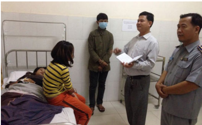
ការចុះសួរសុខទុក្ខ និងតាមដានអាការៈអ្នកជំងឺ

បន្ទាប់ពីមានករណីសន្លប់នេះ គណៈកម្មការ (ស.ទ.ប.ក) បានចាត់វិធានការណ៍ឲ្យ និយោជក អនុវត្តនូវអ្វីដែលគណៈកម្មការ បានណែនាំឲ្យពិនិត្យ និងកែសម្រួលឡើង វិញនូវលក្ខខណ្ឌការងារ អនាម័យ និង