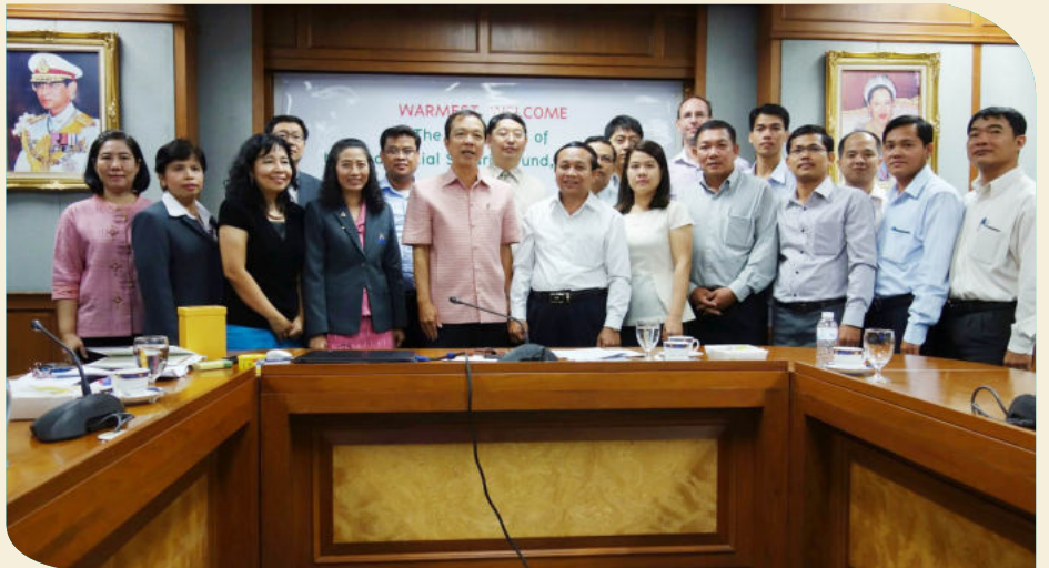
ការថតរូបអនុស្សាវរីយ៍ក្រោយពីដំណើរនៃទស្សនកិច្ច

អ្នកផ្តល់សេវា, នីតិវិធីចុះកិច្ចសន្យាជាមួយអ្នកផ្តល់សេវា វិធីសាស្ត្រទូទាត់សំណង វិធីសាស្ត្រសម្រាប់ផ្ទុកទិន្នន័យសំខាន់ៗ និងដំណាក់កាលនៃការផ្តល់សុពលភាព,