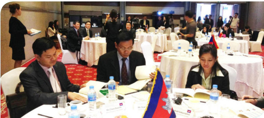
កិច្ចពិភាក្សាជាគ្រុមរបស់ថ្នាក់ដឹកនាំ ប.ស.ស និងមន្ត្រីក្រោមឱវាទ