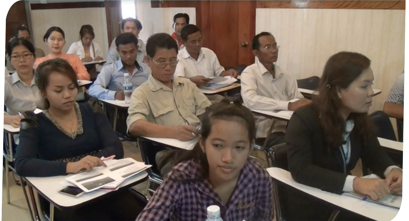
ទិដ្ឋភាពនៃការចូលរួមរបស់និយោជក និងតំណាង ម្ចាស់សហគ្រាស