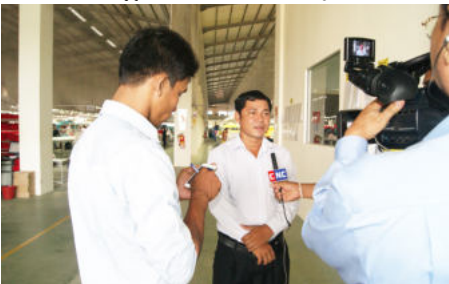
ការធ្វើទស្សនាសម្ភាសជាមួយរដ្ឋបាលរោងចក្រ

នៅថ្ងៃទី១៨ ខែសីហា ឆ្នាំ២០១៤ គណៈកម្មការសិក្សាស្រាវជ្រាវទប់ស្កាត់ករណីសន្លប់ និងបង្ការគ្រោះថ្នាក់ការងារ (ស.ទ.ប.ក) បានចុះទៅតំបន់ស្ថានឧស្សាហកម្មវត្សរៈ២ ដែលមានទីតាំងស្ថិតនៅបណ្តោយផ្លូវជាតិលេខ៣ ភូមិទឹកថ្លា សង្កាត់ក្រាំងពង្រ ខណ្ឌដង្កោ រាជធានីភ្នំពេញ ដើម្បីពិនិត្យស្ថានភាពសុខភាពកម្មករនិយោជិត