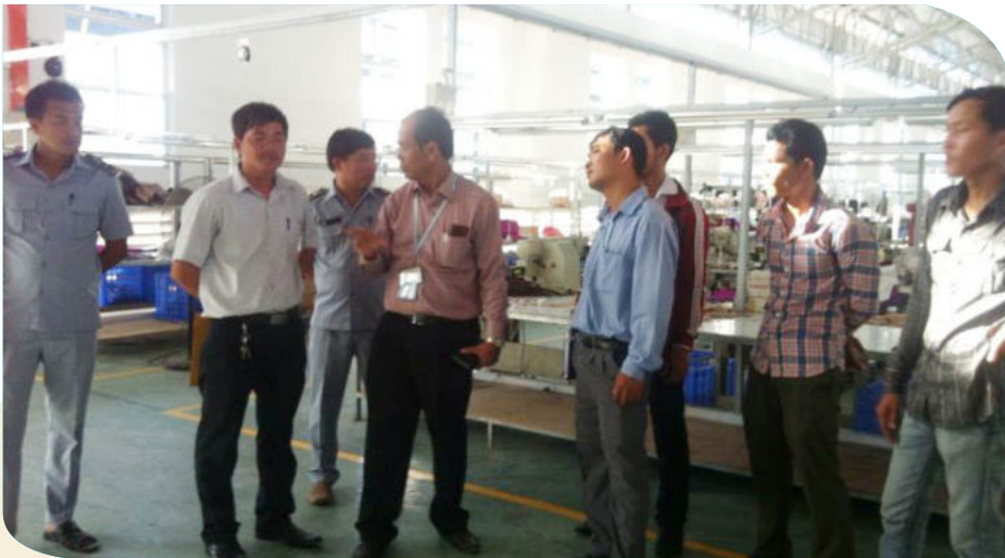
ការត្រួតពិនិត្យ និងណែនាំដល់និយោជិតនៅកន្លែងកើតហេតុ

ក្រោមដីអាគារផលិត(អាគារB) និងបាក់ ពិដានអាគាររបស់រោងចក្រ NISHIKU ENTERPRISE CO.,LTD ដែលបម្រើ សកម្មភាពសេដ្ឋកិច្ចផលិតសម្លៀកបំពាក់