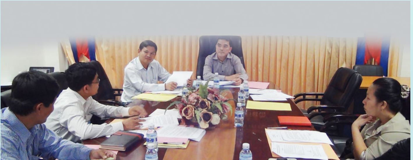
ការប្រជុំសម្រេចរបៀបវារៈផ្សេងៗរបស់គណៈកម្មការ

ទៀតភាគីប្តឹងតវ៉ាអាចជំទាស់ទៅនឹងសេចក្តីសម្រេចរបស់គណៈកម្មការ ដោយជូនព័ត៌មានជាលាយលក្ខណ៍អក្សរទៅនាយកបេឡាជាតិរបបសន្តិសុខសង្គម ក្នុងរយៈពេលប្រាំបីថ្ងៃ បន្ទាប់ពីបានទទួលសេចក្តីសម្រេច។ ក្នុងករណីនេះភាគីប្តឹងតវ៉ាអាចប្តឹងទៅតុលាការមានសមត្ថកិច្ច ដើម្បីដោះ