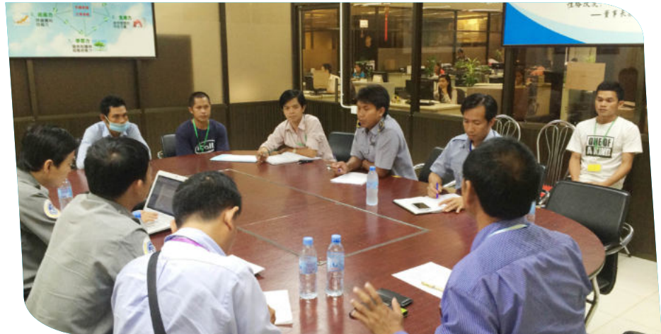
ការពន្យល់ណែនាំ របស់ក្រុមការងារដល់និយោជិត និងតំណាងនិយោជក

ភិតភ័យ ស្លន់ស្លោរ និងទន់ដៃទន់ជើងត្រូវ បានបញ្ជូនទៅសង្គ្រោះ នៅមន្ទីរពេទ្យបាន ទាន់ពេល។ ចំពោះរាល់ការចំណាយលើការ ព្យាបាលជាបន្ត របស់បេឡាជាតិរបប សន្តិសុខសង្គម។ ដើម្បីសម្របសម្រួល ស្ថានភាព ឲ្យវិលទៅរកសភាពដើមវិញ គណៈកម្មការបានចាត់វិធានការណ៍ដាក់ជូន សហគ្រាសគ្រឹះស្ថាន ឲ្យធ្វើការកែលំអះ ស្នើឲ្យកម្មករនិយោជិត នៅផ្នែកម៉ាស៊ីនដុង ត្រូវត្រួតពិនិត្យដោយខ្លួនឯង ដើម្បីឲ្យជាង ភ្លើង / ជាងម៉ាស៊ីនបានជួសជុលទាន់ពេល វេលា, ក្រុមជាងភ្លើង/ជាងម៉ាស៊ីនត្រូវត្រួត ពិនិត្យមើលការងារបច្ចេកទេសរៀងខ្លួនជា ប្រចាំ, បន្ថែមទីតាំងគិលានដ្ឋាន៣ទៀតដើម្បី ឲ្យកម្មករនិយោជិតងាយស្រួលទទួលសេវា សង្គ្រោះបឋម អនុញ្ញាតឲ្យកម្មករនិយោជិត ដែលសន្លប់ទាំង១១នាក់ ចូលធ្វើការវិញនៅ ថ្ងៃច័ន្ទទី០៨ ខែកញ្ញា ឆ្នាំ២០១៤ ក្រោម ការត្រួតពិនិត្យ របស់គ្រូពេទ្យគិលានដ្ឋាន និងមន្ត្រី ប.ស.ស ខេត្ត ។