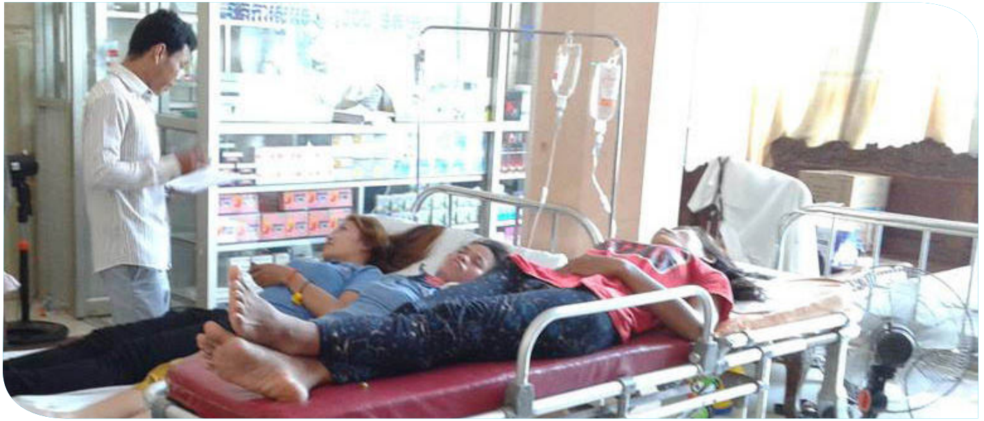
ការចុះសម្របសម្រួលរបស់មន្ត្រី (ប.ស.ស) សាខាខេត្តនៅមន្ទីរពេទ្យក្រុងបាវិត

លេខ ១២៥ សកបយ និងប្រកាសលេខ ១៤៧ សកបយ, បើកប្រព័ន្ធខ្យល់ចេញចូលឲ្យបាន៣០នាទីទើបអនុញ្ញាតឲ្យកម្មករនិយោជិតចូលធ្វើការ អនុញ្ញាតឲ្យកម្មករនិយោជិតទាំងអស់រួមទាំងកម្មការិនីសន្លប់ទាំង ៨៤នាក់ ចូល ធ្វើការនៅថ្ងៃច័ន្ទទៅ០៦ ខែតុលា ឆ្នាំ២០១៤ ក្រោមការត្រួតពិនិត្យរបស់គ្រូពេទ្យ និងគណៈកម្មការដើម្បីចាំមើលពីស្ថានភាពសុខភាព ជាមុនសិន