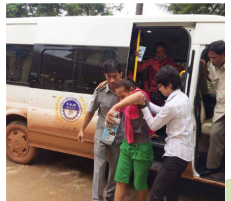
សកម្មភាពសម្របសម្រួលរបស់មន្ត្រី ប.ស.ស ចុះជួយជនរងគ្រោះនៅកន្លែងកើតហេតុ