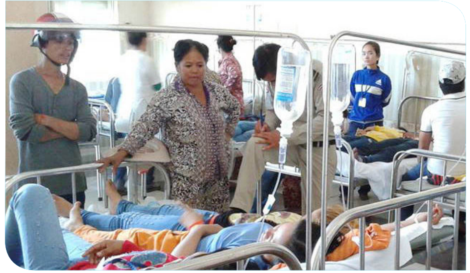
ទិដ្ឋភាពសម្រាកព្យាបាលអ្នកជំងឺ និងការសម្របសម្រួលរបស់មន្ត្រី ប.ស.ស សាខាខេត្ត

មុននឹងអនុញ្ញាត ឲ្យកម្មករនិយោជិតចូលធ្វើការជាធម្មតាវិញ។