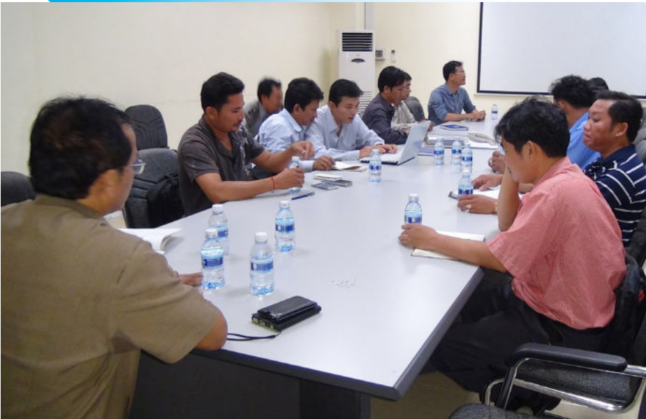
ការប្រជុំពិភាក្សាជាមួយសហជីព និងតំណាងរោងចក្រ អំពីករណីកម្មករសន្លប់

នៅថ្ងៃទី១៨ ខែសីហា ឆ្នាំ២០១៤ គណៈកម្មការសិក្សាស្រាវជ្រាវទប់ស្កាត់ករណីសន្លប់ និងបង្ការគ្រោះថ្នាក់ការងារ (ស.ទ.ប.ក) បានចុះទៅតំបន់ស្ថានឧស្សាហកម្មវត្សរៈ២ ដែលមានទីតាំងស្ថិតនៅបណ្តោយផ្លូវជាតិលេខ៣ ភូមិទឹកថ្លា សង្កាត់ក្រាំងពង្រ ខណ្ឌដង្កោ រាជធានីភ្នំពេញ ដើម្បីពិនិត្យស្ថានភាពសុខភាពកម្មករនិយោជិត