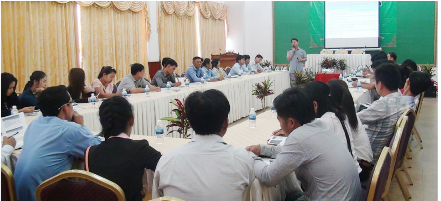
ទិដ្ឋភាព នៃការប្រជុំផ្សព្វផ្សាយ

របបធានារ៉ាប់រងសុខភាព នៅចុងឆ្នាំ ២០១៤ ឬដើមឆ្នាំ២០១៥ លោកបានណែនាំបន្ថែមផងដែរអំពីសារៈសំខាន់ នៃការចុះសំបុត្រអាពាហ៍ពិពាហ៍ សម្រាប់អ្នកដែលរៀបការរួចហើយ និងសំបុត្រកំណើត ឬការចុះអត្រានុកូលដ្ឋាន ដើម្បីមានសិទ្ធិទទួល បានតារាការណិក (អត្ថប្រយោជន៍) សម្រាប់ អ្នកដែលនៅក្នុងបន្ទុករបស់ជនរងគ្រោះ ដែលជនរងគ្រោះបានទទួលរងគ្រោះថ្នាក់ រហូតដល់បាត់បង់ជីវិត ដែល ប.ស.ស ចាត់ទុកថាជាគ្រោះថ្នាក់ការងារ។