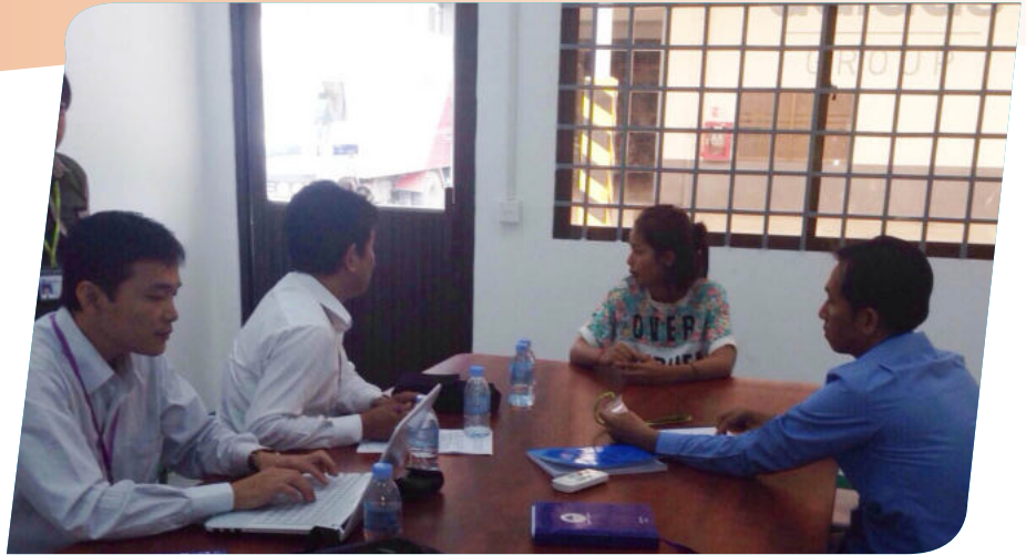
កិច្ចពិភាក្សាទាញរកមូលហេតុរបស់គណៈកម្មការ ស.ទ.ប.ក

កាលពីថ្ងៃទី២៤ ខែតុលា ឆ្នាំ២០១៤ គណៈកម្មការសិក្សាស្រាវជ្រាវទប់ស្កាត់ ករណីសន្លប់ និងបង្កគ្រោះថ្នាក់ការងារ (ស.ទ.ប.ក) បានចុះអង្កេតករណីសន្លប់ នៅរោងចក្រ DIN HAN ENTERPRISE Co.,LTD ដែលស្ថិតនៅផ្លូវខ្វែងរៀបសង្កាត់ ស្ទឹងមានជ័យ ខណ្ឌមានជ័យ រាជធានី ភ្នំពេញ ដែលមានកម្មករនិយោជិត សរុប ចំនួន១,៥០០នាក់ (ប្រុស ២៣០នាក់) ក្នុងនោះមានកម្មករនិយោជិតសន្លប់សរុប