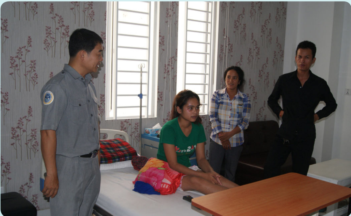
ការចុះសាកសួរព័ត៌មាន និងតាមដានស្ថានភាពរបស់អ្នកជំងឺនៅមន្ទីរពេទ្យ

ឬសាច់ញាតិឲ្យជូនដំណឹងទៅរដ្ឋបាលរោងចក្រឬស្ថាប័នរបស់ខ្លួន ដើម្បីរៀបចំឯកសារបញ្ជូនភ្ជាប់ជាមួយជនរងគ្រោះ ឲ្យបានទាន់ពេលវេលាទៅមន្ទីរពេទ្យជៀសវាងមានការយល់ច្រឡំពីមន្ទីរពេទ្យ ដែលបានចុះកិច្ចសន្យាជាមួយ ប.ស.ស ក្នុងការបង់ថ្លៃសេវាមុនការព្យាបាល។ លោកបានបន្តថាបើសិនជាយើងចេញថ្លៃព្យាបាលមុន យើងកុំភ្លេចយកវិក្កយបត្រពីមន្ទីរពេទ្យ (ធ្វើការលំអិតឲ្យបានគ្រប់ជ្រុងជ្រោយ) ដើម្បីធ្វើការទាមទារថ្លៃសំណងពី បេឡាជាតិ របបសន្តិសុខសង្គមវិញ។ ចំពោះរាល់ការចំណាយលើថ្លៃព្យាបាល ជាបន្ទុករបស់បេឡាជាតិរបបសន្តិសុខសង្គមទាំងស្រុង។