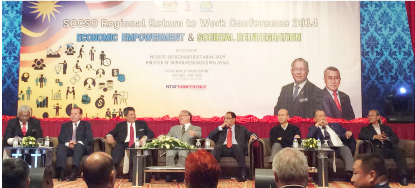
ទិដ្ឋភាពចូលរួមរបស់ប្រធានសន្និសីទថ្នាក់តំបន់ និងសមាជិកក្នុងអង្គពិធី

ការបណ្តុះបណ្តាលសមត្ថភាពផ្នែកធនធានមនុស្សនិងការជំរុញផ្នែកវិស័យសាធារណៈនិងឯកជន ក៏ដូចជាការផ្តល់មតិយោបល់បន្ថែម និងបទពិសោធន៍ ដល់រដ្ឋសមាជិកអាស៊ាន ទៅវិញទៅមក ក្នុងការទំនាក់ទំនងនៃឧបករណ៍កិច្ចគាំពារសង្គម និងដើម្បី