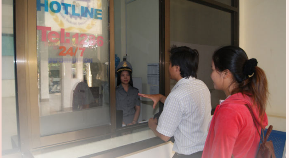
សកម្មភាពទំនាក់ទំនងការងារ របស់អតិថិជនជាមួយក្រុមការងារ Hotline

ទន្ទឹមនឹងទទួលបាន លទ្ធផលជាផ្លែផ្កាក្តី ក៏នៅមានបញ្ហាប្រឈម មួយចំនួនដែរ ដែល តម្រូវឲ្យក្រុមការងារ HOTLINE នៅតែខិត ខំប្រឹងប្រែងដោះស្រាយ រាល់ការប្រឈមនោះ ឲ្យមានភាពរលូន និងហ័សទាន់ ពេលវេលា ដើម្បីបម្រើសេវាសាធារណៈ ជូនដល់សមា ជិក នៃបេឡាជាតិរបបសន្តិសុខសង្គម ឲ្យ បានល្អបន្ថែមទៀត។