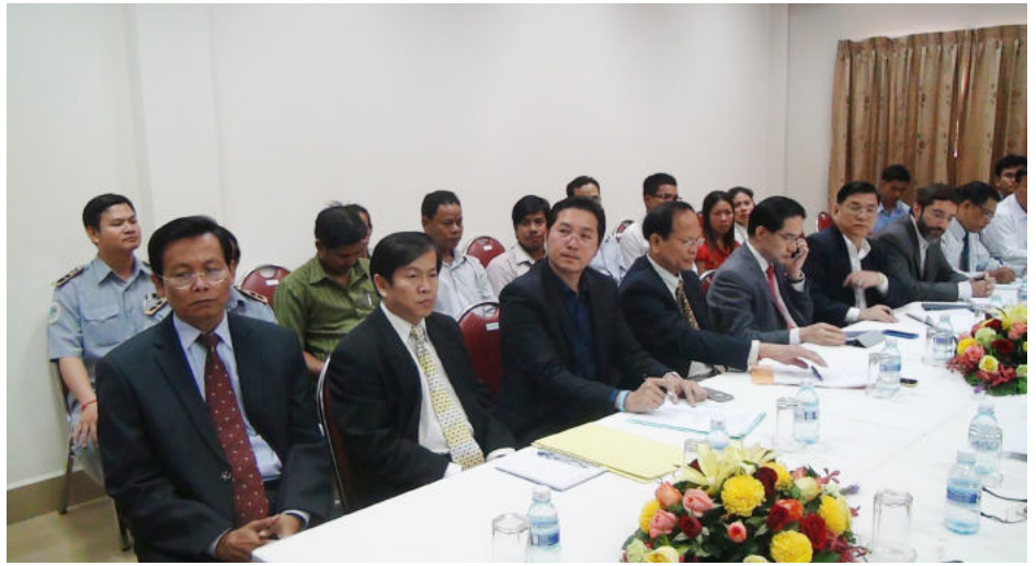
ទិដ្ឋភាពចូលរួមរបស់ថ្នាក់ដឹកនាំ ប.ស.ស និងក្រសួង/ស្ថាប័ន និងអង្គការពាក់ព័ន្ធ

ដែល ប.ស.ស សម្រេចបានគួរជាទីមោទនៈ ចាប់តាំងពីការចាប់ផ្តើមដំណើរការរបបធានារ៉ាប់រងហានិភ័យការងារប្រកបដោយជោគជ័យរហូតមកដល់ពេលបច្ចុប្បន្ននេះ។ ស្របគ្នានេះដែរ ប.ស.ស បានត្រៀមខ្លួនក្នុងការដាក់ឱ្យដំណើរការរបបធានារ៉ាប់រងពីរផ្សេងទៀតនាពេលខាងមុខ។ បន្ទាប់ពីនេះ ឯកឧត្តមរដ្ឋមន្ត្រី ក្រសួងការងារ និងបណ្តុះបណ្តាលវិជ្ជាជីវៈ បានកោតសរសើរ ពីលទ្ធផលការងាររបស់ ប.ស.ស និងជំរុញឱ្យអង្គភាព