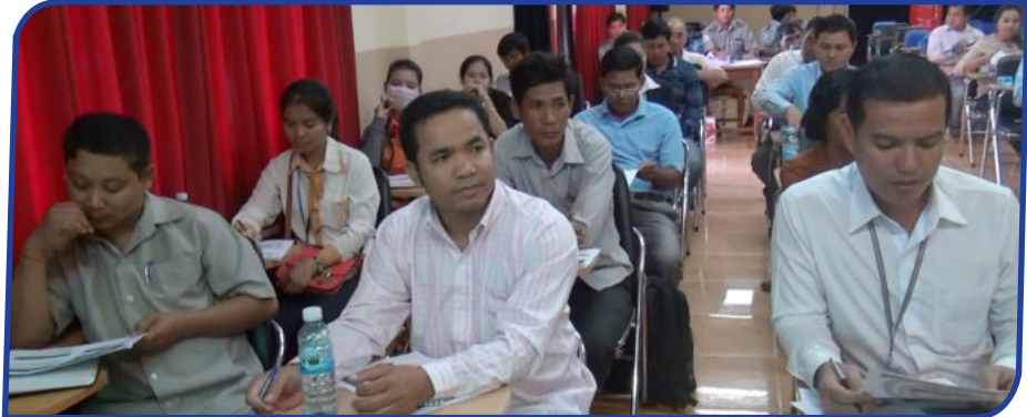
ទិដ្ឋភាពនៃការចូលរួមរបស់និយោជក និងកម្មករនិយោជិត នៃអ្នកនៅក្នុងបន្ទុកផ្ទាល់

ករណីជនរងគ្រោះ ទទួលរងគ្រោះថ្នាក់ការងាររហូត ដល់បាត់បង់ជីវិតជាច្រើនករណី ដែលអ្នកនៅក្នុងបន្ទុកផ្ទាល់មិនបានទទួលតារាកាលិកឧត្តរជីវី ដោយជនរងគ្រោះមិនបានចុះសំបុត្រអាពាហ៍ពិពាហ៍។