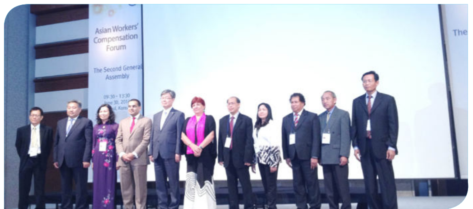
ការថតរូបអនុស្សាវរីយ៍របស់បណ្តាប្រទេសចូលរួម

និងយល់ដឹងអំពីការបង្កើត ច្បាប់បទដ្ឋាន គតិយុត្ត គោលការណ៍ច្បាប់នៃការអនុវត្ត វិស័យសន្តិសុខសង្គម យុទ្ធសាស្ត្រចតុ កោណរបស់រាជរដ្ឋាភិបាល និងផែនការយុទ្ធ សាស្ត្រនៃផ្នែកនានាមួយចំនួន ដែលផ្ដោត សំខាន់ទៅលើកិច្ចគាំពារសង្គម សម្រាប់ជន ក្រីក្រ និងជនងាយរងគ្រោះ។ ក្នុងនោះដែរ លោកនាយក ប.ស.ស បានលើកឡើង នូវចំនុចសំខាន់ៗមួយចំនួន នៃការទូទាត់ សំណងគ្រោះថ្នាក់ការងារនៅកម្ពុជា ដែល ប.ស.ស ទទួលបន្ទុកវិស័យនេះមានដូច