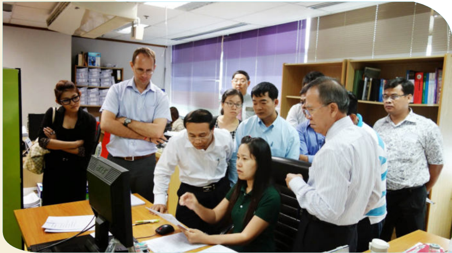
ទិដ្ឋភាពនៃការចុះទស្សនកិច្ចសិក្សាផ្ទាល់ ដល់កន្លែងធ្វើការ

ដំណើរការ នៃការប្រើប្រាស់សេវារបស់សមាជិកក្នុងមន្ទីរពេទ្យ ការគ្រប់គ្រងការប្រើប្រាស់សេវា, ដំណើរការនៃការទាមទារសំណង និងការផ្តល់សំណង, សូចនាករណ៍សំខាន់ៗ ការត្រួតពិនិត្យប្រតិបត្តិការនៃការធានារ៉ាប់រងសុខភាពសង្គម រួមមានផ្នែកបច្ចេកទេស ការវិភាគរបាយការណ៍ហិរញ្ញវត្ថុ ការវិភាគអំពីប្រតិបត្តិការ នៃរបបធានារ៉ាប់រងសុខភាព, ការអភិវឌ្ឍប្រព័ន្ធព័ត៌មានវិទ្យា និងការមើលថែទាំជាដើម។ ដើម្បីយកមកអនុវត្តរបបនេះឱ្យទទួលបានជោគជ័យ និងមានប្រសិទ្ធភាពខ្ពស់នៅកម្ពុជា។