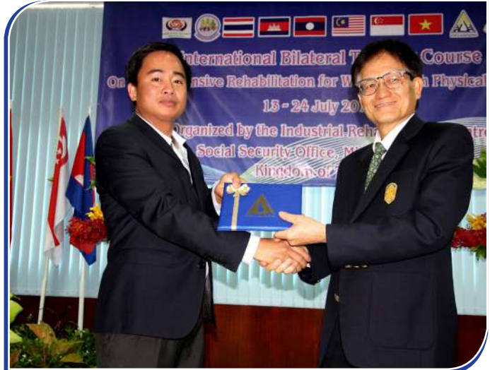
រូបភាពការប្រគល់វត្ថុអនុស្សាវរីយ៍

ប្រព័ន្ធនេះស្ថិតនៅក្រោមការគ្រប់គ្រង ដោយការិយាល័យសុខ សុខសង្គម SSO ក្រោមក្រសួងការងារប្រទេសថៃ ដែលមាន មូលនិធិពីរ គឺមូលនិធិសំណងគ្រោះថ្នាក់ការងារ (Workmen's Compensation Fund) ផ្នែកនេះត្រូវបានផ្តល់ការធានារ៉ាប់រងទៅ លើគ្រោះថ្នាក់ និងជំងឺដែលទាក់ទងនឹងការងារ និងមូលនិធិសុខ សុខសង្គម (Social Security Fund) ផ្តល់ធានារ៉ាប់រងទៅលើជំងឺដែល មិនទាក់ទងនឹងការងារ, ទុព្វលភាព, មរណៈភាព, មាតុភាព, ជរាភាព, វិភាជន៍សម្រាប់កុមារ និងនិកម្មភាព។