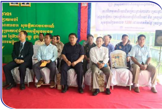
ការអញ្ជើញចូលរួមពីមន្ត្រីថ្នាក់ដឹកនាំក្រោមឱវាទ

ទន្ទឹមនឹងនេះ និយោជក ឬតំណាងរោងចក្រត្រូវយកចិត្តទុកដាក់ពីបញ្ហាអនាម័យ សុខភាព សុវត្ថិភាពការងារ ពិសេសនៅកន្លែងធ្វើការរបស់បងប្អូនកម្មករនិយោជិត ដោយធ្វើយ៉ាងណា ឱ្យបរិយាកាសទាំងនៅកន្លែងធ្វើការ និងនៅជុំវិញកន្លែងធ្វើការត្រូវមានខ្យល់អាកាសល្អ គ្រប់គ្រាន់ និងគ្មានការសាយភាយ ឬមានក្លិនសារធាតុគីមី ព្រមទាំងធ្វើការណែនាំឱ្យកម្មករនិយោជិត បានយល់ដឹងអំពីអាហាររូបត្ថម្ភផងដែរ។