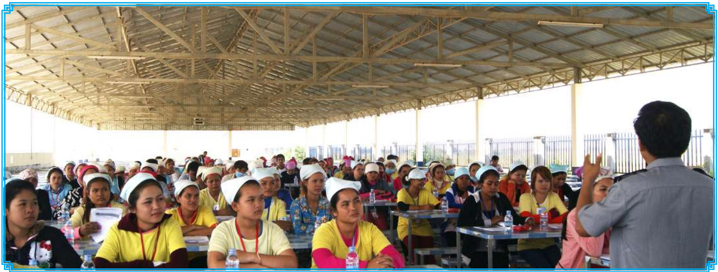
ការធ្វើបទបង្ហាញ ស្តីពីច្បាប់ចរាចរណ៍ផ្លូវគោក