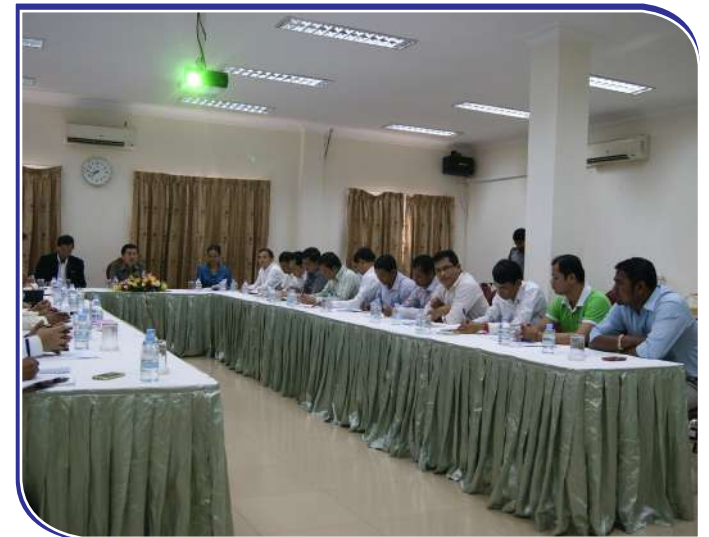
សិក្ខាកាមចូលរួមក្នុងកិច្ចប្រជុំស្តីពីការកំណត់អត្តសញ្ញាណកម្មករនិយោជិត និងសមាជិកមូលដ្ឋាន

ស្របគ្នានេះ ប.ស.ស ក៏ត្រៀមនឹងដាក់ឱ្យដំណើរការផ្នែកធានារ៉ាប់រងសុខភាព ដែលជាជំហានទី២ របស់ខ្លួនក្នុងពេលឆាប់ៗខាងមុខនេះ បន្ទាប់ពីផ្នែកធានារ៉ាប់រងហានិភ័យការងារ (គ្រោះថ្នាក់ការងារ) ដែលជាជំហានទី១។