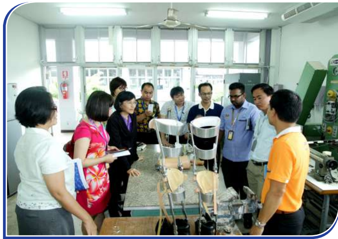
ការចុះទស្សនកិច្ចនៅកន្លែងការងារបច្ចេកទេស

សម្រាប់កម្មករនិយោជិតពិការ រយៈពេល២ សប្តាហ៍ ចាប់ពីថ្ងៃទី ១៣ ដល់ថ្ងៃទី២៤ ខែកក្កដា ឆ្នាំ២០១៥ នៅមជ្ឈមណ្ឌលផ្តល់សេវា បុរេនីតិសម្បទា IRC តាមរយៈអង្គការសុខសង្គម ប្រទេសថៃ SSO។ ការរៀបចំកម្មវិធីបណ្តុះបណ្តាលនេះគឺ ដើម្បីធ្វើការផ្លាស់ ប្តូរទម្រង់នៃការងារ ពីការផ្តល់សេវានេះ ដល់សមាគមសុខសង្គម អាស៊ាន ASSA និងមានការធ្វើបទបង្ហាញនូវបទពិសោធន៍របស់