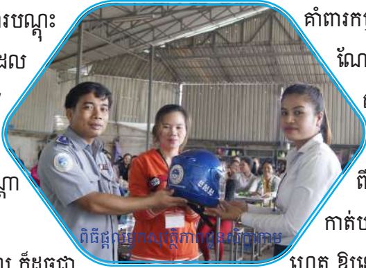
ពិធីផ្តល់សុវត្ថិភាពដល់ប្រាកប

គាំពារកម្មករនិយោជិត ដើម្បីធ្វើការផ្សព្វផ្សាយអប់រំ ណែនាំដល់អ្នកបើកបរនៅតាមបណ្តារោងចក្រ សហគ្រាស គ្រឹះស្ថាន និងអ្នកបើកបរដឹក កម្មករនិយោជិតទាំងអស់ ឱ្យបានយល់ដឹង ពីច្បាប់ចរាចរណ៍ផ្លូវគោក ដើម្បីរួមចំណែក កាត់បន្ថយគ្រោះថ្នាក់ដែលកើតមានឡើងដោយថា ហេតុ ឱ្យនៅកម្រិតមួយទាប ជាអប្បបរមា ដែលអាច