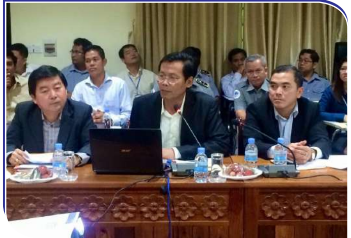
បទបង្ហាញរបស់នាយក ប.ស.ស ស្តីពីការអនុវត្តរបបសន្តិសុខសង្គម ផ្នែកហានិភ័យការងារ

កត្តាដែល ប.ស.ស ត្រូវបានចាត់ទុកជាអង្គការឆ្នើមផ្នែកវិនិច្ឆ័យ (Innovation Excellence) មានដូចខាងក្រោម៖