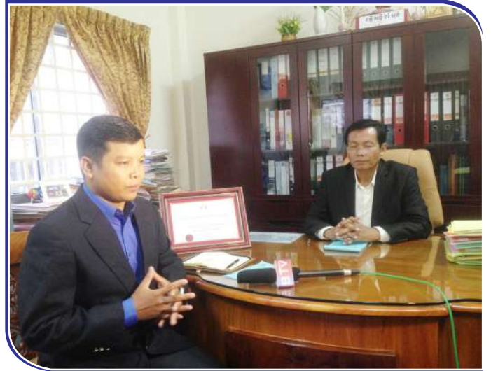
ការបទសម្ភាសរវាងអ្នកសារព័ត៌មានជាមួយលោកនាយក ប.ស.ស និងមានកម្មករនិយោជិតសរុប ១.០៦០.៩៤៧ នាក់។ ក្នុងរយៈពេល ជិត ៧ ឆ្នាំមកនេះ សមាជិកដែលទទួល ហានិភ័យការងារ (គ្រោះ ថ្នាក់ការងារ) គិតជាមធ្យមប្រមាណ ១,៧% នៃសមាជិកសរុប ត្រូវបានចំណាយថវិកាប្រមាណ ៣៦,៦៤៧.៣១៧.៨០០ រៀល។

ប.ស.ស ត្រូវបានចាប់ផ្តើមអនុវត្តរបបសន្តិសុខសង្គម ផ្នែកហានិ ភ័យការងារ សម្រាប់ជនទាំងឡាយដែលស្ថិតនៅក្រោមបទបញ្ញត្តិ នៃច្បាប់ស្តីពីការងារ នាខែវិច្ឆិកា ឆ្នាំ២០០៨ រហូតដល់បច្ចុប្បន្ន ដែល បានចុះបញ្ជីកា សហគ្រាស គ្រឹះស្ថានចំនួន ៧.៥៩៥ សហគ្រាស