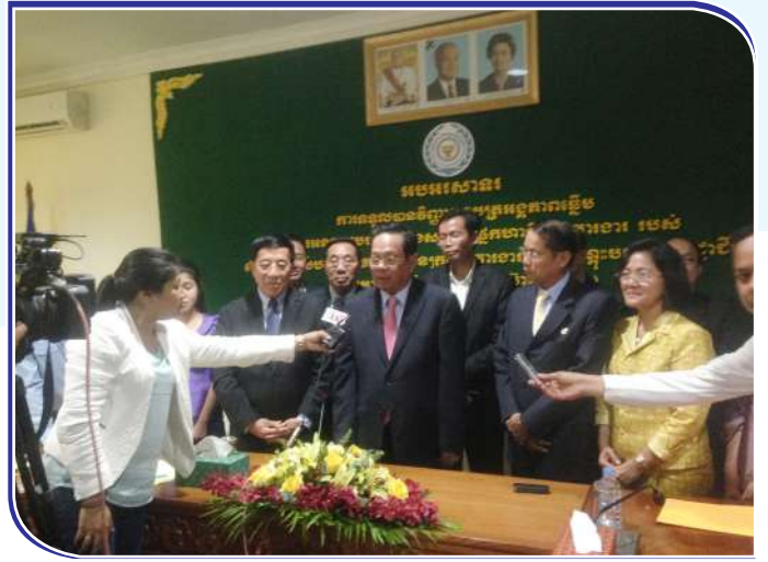
បទសម្ភាសរវាងឯកឧត្តមរដ្ឋមន្ត្រីជាមួយអ្នកសារព័ត៌មាន ក្រសួងការងារ និងបណ្តុះបណ្តាលវិជ្ជាជីវៈផងដែរ ដែលបានចូល ជាសមាជិកកាលពីថ្ងៃទី២៥ ខែមីនា ឆ្នាំ២០១១។

ASSA ជាអង្គការមួយត្រូវបានបង្កើតឡើង តាំងពីថ្ងៃទី១៣ ខែ កុម្ភៈ ឆ្នាំ១៩៩៨ រហូតដល់បច្ចុប្បន្ន មានប្រទេសបណ្តាសមាគមប្រ ជាជាតិអាស៊ីអាគ្នេយ៍ចំនួន ១០ បានចូលជាសមាជិក ក្នុងនោះមាន ១៨ អង្គការសន្តិសុខសង្គម រួមបញ្ចូលទាំងអង្គការ ប.ស.ស នៃ