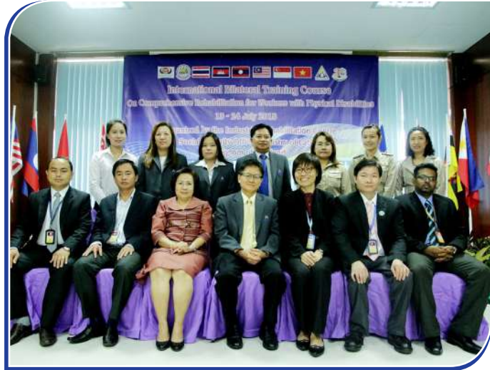
ការថតរូបអនុស្សាវរីយ៍

វគ្គនេះដែរមានការចូលរួមពីមន្ត្រី SSO និងIRC នៅថ្នាក់កណ្តាល និងតាមខេត្ត ព្រមទាំងសមាជិក ASSA ០៥ប្រទេសមានអ្នកចូលរួម ចំនួន ០៦ នាក់មកពីប្រទេសកម្ពុជា, ប្រទេសឡាវ, ប្រទេសសិង្ហបុរី, ប្រទេស ម៉ាឡេស៊ី និងប្រទេសវៀតណាម។