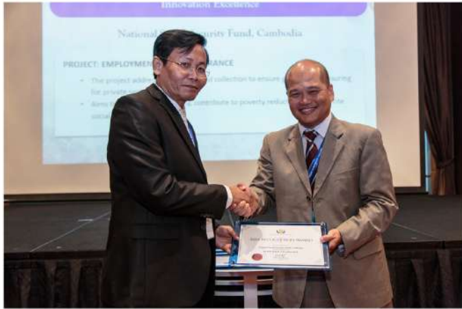
រូបភាពការទទួលបានវិញ្ញាបនបត្រជាអង្គការឆ្នើម ពីប្រធានសមាគមអាស៊ាន