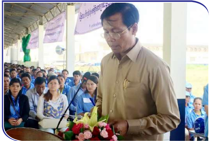
លោកនាយក ប.ស.ស ឡើងថ្លែងសូន្យកថាក្នុងកិច្ចប្រជុំ

ក្នុងទិសដៅអនាគត ក្រសួងការងារ និងបណ្តុះបណ្តាលវិជ្ជាជីវៈ ដែលមាន ប.ស.ស ជាសេនាធិការបាននឹងកំពុងរៀបចំដាក់ដំណើរ