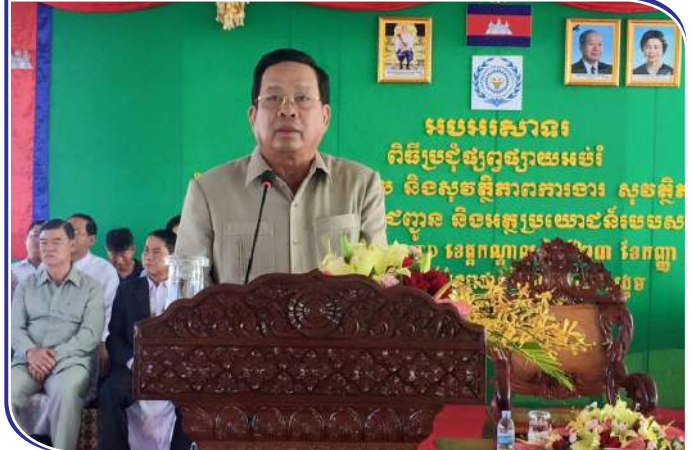
ឯកឧត្តមរដ្ឋមន្ត្រី អញ្ជើញថ្លែងសុន្ទរកថា និងផ្តល់អនុសាសន៍ណែនាំក្នុងកិច្ចប្រជុំ

មានទីតាំងស្ថិតនៅឃុំវិហារស្លក់ ស្រុកខ្សាច់កណ្តាល ខេត្តកណ្តាល។ គោលបំណងនៃការជួបជុំជាមួយបងប្អូនកម្មករនិយោជិតនាថ្ងៃ នេះដើម្បីឱ្យបងប្អូនកម្មករបានជួបនិងទទួលនូវមតិសំណេះសំណាល ដ៏ឧត្តុង្គឧត្តមពីសំណាក់ ឯកឧត្តមបណ្ឌិត អ៊ិត សំហេង រដ្ឋមន្ត្រី ក្រសួង និងបណ្តុះបណ្តាលវិជ្ជាជីវៈ។ ឯកឧត្តមរដ្ឋមន្ត្រី ក៏បាន លើកឡើងថាពិធីប្រជុំនេះធ្វើឡើងក្នុងគោលដៅ ដើម្បីបង្ការហានិភ័យ ការងារ ឬគ្រោះថ្នាក់ការងារ ដើម្បីឱ្យបងប្អូនកម្មករនិយោជិត ក៏ដូច