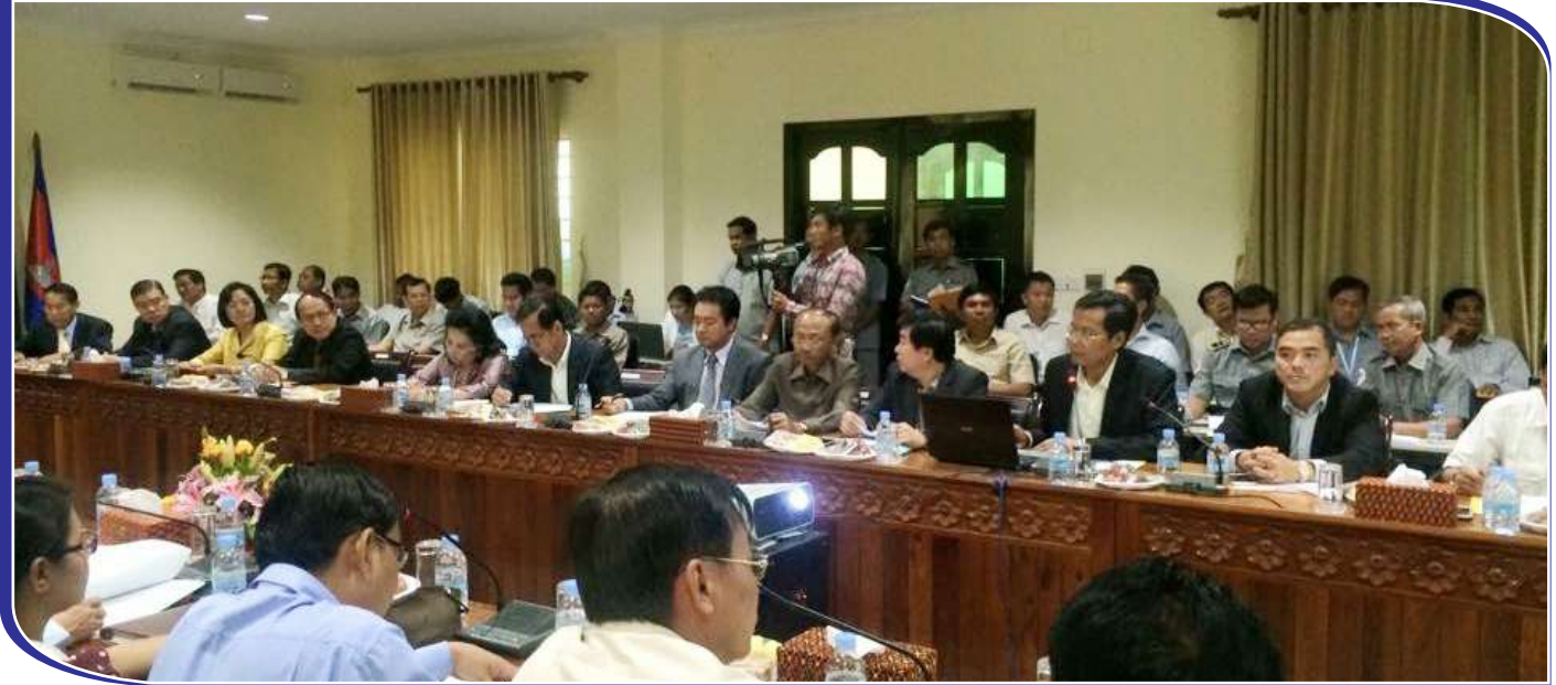
ទិដ្ឋភាពរួមនៃកិច្ចប្រជុំ