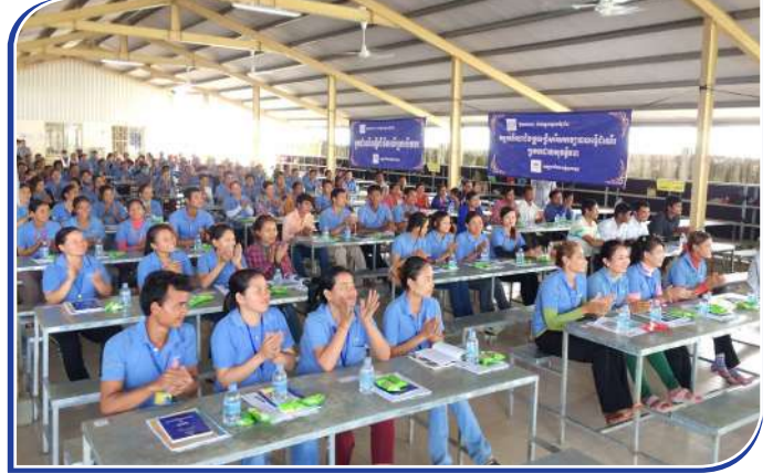
សិក្ខាកាមដែលជាកម្មករនិយោជិត ចូលរួមក្នុងអង្គពិធី

នៅក្នុងបន្ទុកផ្ទាល់របស់ជនរងគ្រោះ ដែលមិនទាន់ទទួលបានអត្ថប្រយោជន៍ពី ប.ស.ស និងសមាជិក ប.ស.ស ណាដែលពុំទាន់បានទទួលអត្ថប្រយោជន៍ ដូចជាការព្យាបាលឡើងវិញ ដែលមុខរបួសមិនទាន់ជាសះស្បើយនៅឡើយ និងសិទ្ធិទទួលបានអត្ថប្រយោជន៍ដទៃទៀត ត្រូវជូនដំណឹងជាបន្ទាន់មក ប.ស.ស ដើម្បីឱ្យ ប.ស.ស ចាត់ចែង និងផ្តល់ជូនសំណងវិញ។