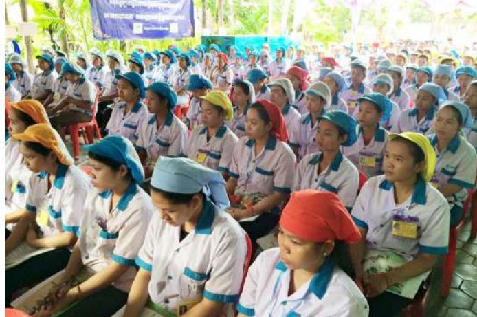
សិក្ខាកាម ដែលជាកម្មករនិយោជិត ចូលរួមក្នុងកិច្ចប្រជុំ

ជាពិសេសការប្រជុំផ្សព្វផ្សាយនេះ ធ្វើឡើងស្របតាមគោលការណ៍ របស់រាជរដ្ឋាភិបាល ដែលបាននឹងកំពុងយកចិត្តទុកដាក់លើសុខទុក្ខ