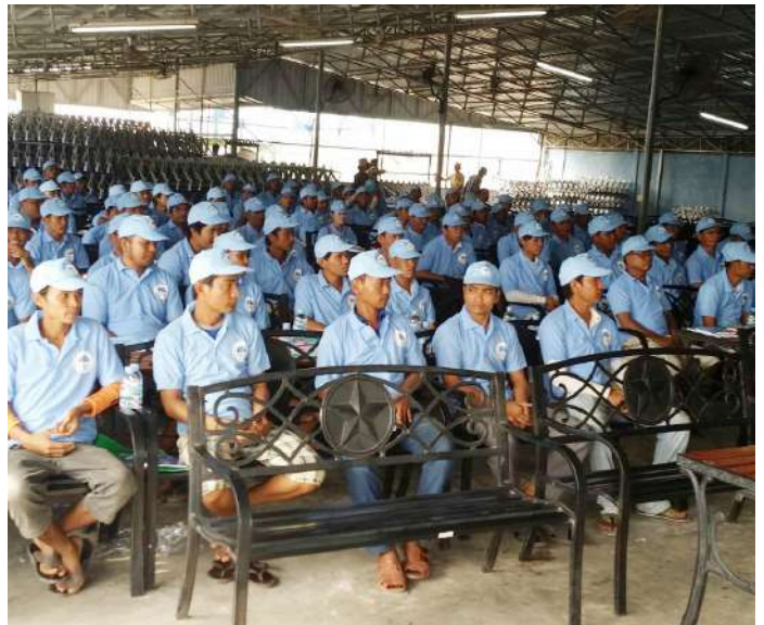
សិក្ខាកាមដែលជាអ្នកបើកបរដឹកកម្មករនិយោជិតចូលរួមវគ្គបណ្តុះបណ្តាល

គោលបំណងកិច្ចប្រជុំនេះធ្វើឡើង ដើម្បីអប់រំណែនាំដល់កម្មករ និយោជិត ឱ្យបានយល់ច្បាស់ពីច្បាប់ ស្តីពីចរាចរណ៍ផ្លូវគោក បច្ចេកទេសត្រួតពិនិត្យយានយន្ត និងវិជ្ជាសង្គ្រោះបឋម ដើម្បីឱ្យ ស្របតាមផែនការសកម្មភាព របស់បេឡាជាតិរបបសន្តិសុខសង្គម នៃក្រសួងការងារ និងបណ្តុះបណ្តាលវិជ្ជាជីវៈ ដើម្បីចូលរួមផ្សព្វ- ផ្សាយអប់រំបង្ការ និងទប់ស្កាត់កាត់បន្ថយគ្រោះថ្នាក់ការងារ ដែល ផ្តោតសំខាន់លើគ្រោះថ្នាក់ពេលធ្វើដំណើរពីកន្លែងធ្វើការទៅផ្ទះ និងពីផ្ទះទៅកន្លែងធ្វើការផងដែរ។