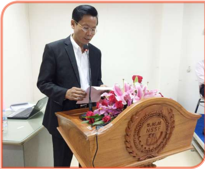
លោក អ៊ុក សមរិទ្ធា នាយក ប.ស.ស ថ្លែងសុន្ទរកថាក្នុងកិច្ចប្រជុំ