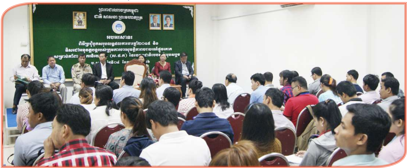
សិក្ខាកាមដែលជាតំណាងនិយោជក ម្ចាស់សហគ្រាស គ្រឹះស្ថានចូលរួមក្នុងកិច្ចប្រជុំ