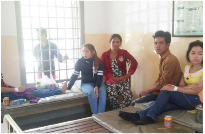
រូបភាពជនរងគ្រោះសម្រាកព្យាបាលនៅមន្ទីរពេទ្យ

សម្រួលជាមួយរដ្ឋបាលរោងចក្រ បញ្ជូនជនរងគ្រោះទៅសង្គ្រោះនៅមន្ទីរពេទ្យបង្អែកស្រុកខ្សាច់កណ្តាល។ ចំពោះរាល់ការចំណាយទៅលើសេវាព្យាបាលរហូត ដល់ជាសះស្បើយជាបន្តករបស់បេឡាជាតិ របបសន្តិសុខសង្គម (ប.ស.ស) ទាំងស្រុង។