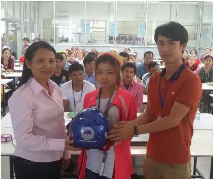
ពិធីផ្តល់មូកសុវត្ថិភាពជូនដល់សិក្ខាកាម

ដើម្បីធ្វើការកាត់បន្ថយនូវគ្រោះថ្នាក់ទាំងនេះ ទើបនៅក្នុងខែ កុម្ភៈ ឆ្នាំ២០១៦ ក្រុមសុវត្ថិភាពចរាចរណ៍ផ្លូវគោកសម្រាប់គាំពារ កម្មករនិយោជិត នៃបេឡាជាតិរបបសន្តិសុខសង្គម បានរៀបចំ កិច្ចប្រជុំផ្សព្វផ្សាយអប់រំ និងស្រង់ស្ថិតិអ្នកបើកបរដឹកកម្មករឱ្យ