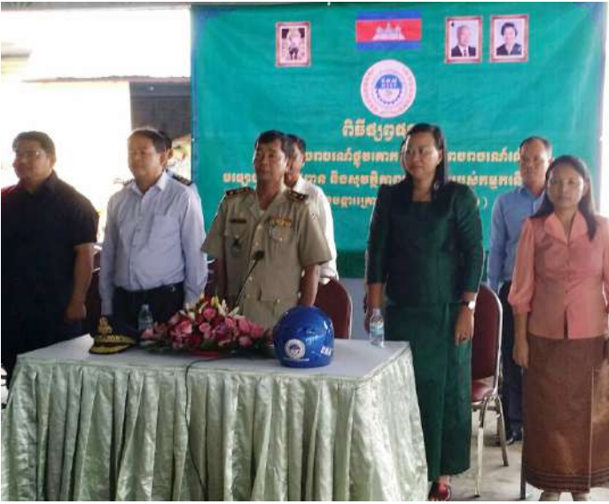
អធិបតីអញ្ជើញចូលរួមក្នុងវគ្គបណ្តុះបណ្តាល

ដោយមើលឃើញពីបញ្ហាគ្រោះថ្នាក់ចរាចរណ៍ នៅដើមឆ្នាំ ២០១៦នេះ នៅតែបន្តកើតមានជារៀងរាល់ថ្ងៃ ភាគច្រើនផ្តើម ចេញពីអ្នកបើកបរមិន បានគោរពច្បាប់ចរាចរណ៍ឱ្យបានខ្ជាប់ខ្ជួន ដោយមានការធ្វេសប្រហែស ការបើកបរល្មើសល្បឿនការបើកបរ ក្រោមឥទ្ធិពល នៃគ្រឿងស្រវឹងជាដើម ។