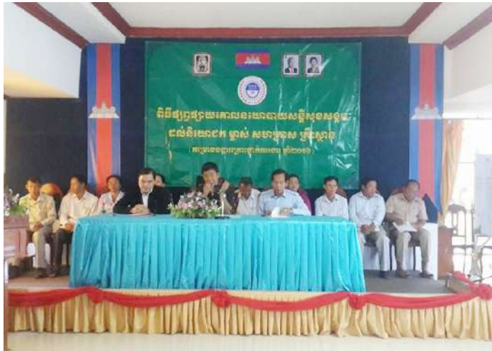
អធិបតីចូលរួម ក្នុងអង្គពិធី

ក្នុងន័យបង្កើនការយល់ដឹងក្នុងការអនុវត្ត និងសិទ្ធិក្នុងការទទួលបានតាវកាលិកដែលជាផ្នែកមួយដ៏សំខាន់ ដោយមានការចូលរួមពីគ្រប់ភាគីក្នុងការដោះស្រាយបញ្ហារួមគ្នា ដើម្បីអភិវឌ្ឍកិច្ចដំណើរការប្រព្រឹត្តទៅរបស់ ប.ស.ស ឱ្យកាន់តែល្អ និងមានប្រសិទ្ធភាពខ្ពស់បន្ថែមទៀត។