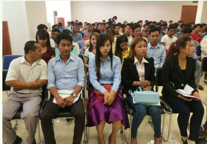
សិក្ខាកាមចូលរួមក្នុងអង្គពិធី

គ្រោះថ្នាក់ចរាចរណ៍លើមធ្យោបាយដឹកជញ្ជូន និងមធ្យោបាយធ្វើ ដំណើររបស់កម្មករនិយោជិតពីមួយថ្ងៃទៅមួយថ្ងៃកើតឡើងជាបន្ត បន្ទាប់។ នៅក្នុងឆ្នាំ២០១៣ ក្រសួងបានចេញសេចក្តីសម្រេចបង្កើត ក្រុមការងារសុវត្ថិភាពចរាចរណ៍ផ្លូវគោក សម្រាប់គាំពារកម្មករ និយោជិត (ស.ផ.ក)។ ក្រុមការងារមានសមាសភាពមកពីក្រសួង ការងារ និងបណ្តុះបណ្តាលវិជ្ជាជីវៈ ក្រសួងមហាផ្ទៃ ក្រសួងសា- ធារណការ និងដឹកជញ្ជូន ក្រសួងសុខាភិបាល តំណាងនិយោជក (GMAC) តំណាងកម្មករនិយោជិត (សហជីព) និងអង្គការជនពិការ អន្តរជាតិ។ នៅឆ្នាំ២០១៥ ឯកឧត្តមរដ្ឋមន្ត្រី ក្រសួងការងារ និង