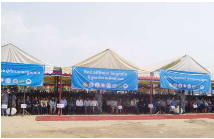
ទិដ្ឋភាពសិក្ខាកាមចូលរួមក្នុងអង្គពិធី

ផ្ទៀងផ្ទាត់ក្នុងឱកាសនេះដែរ ក្នុងនាមអនុប្រធានក្រុមការងារផ្សព្វផ្សាយអប់រំដល់អ្នកបើកបររថយន្តដឹកកម្មករ អ្នកដំណើរ និងដឹកទំនិញ នៃក្រុមការងារទាំង៧ ចំណុះគណៈកម្មាធិការជាតិសុវត្ថិភាពចរាចរណ៍ផ្លូវគោក និងជាប្រធានគណៈកម្មាធិការសុវត្ថិភាពចរាចរណ៍ផ្លូវគោក សម្រាប់គាំពារកម្មករនិយោជិត របស់ក្រសួងការងារ និងបណ្តុះបណ្តាលវិជ្ជាជីវៈ បានអនុវត្តការងារយ៉ាងសម្រាប់សម្រាប់ គិតចាប់ពីឆ្នាំ២០១៣ រហូតដល់ត្រឹមត្រឹមមាសទី១ ឆ្នាំ២០១៦