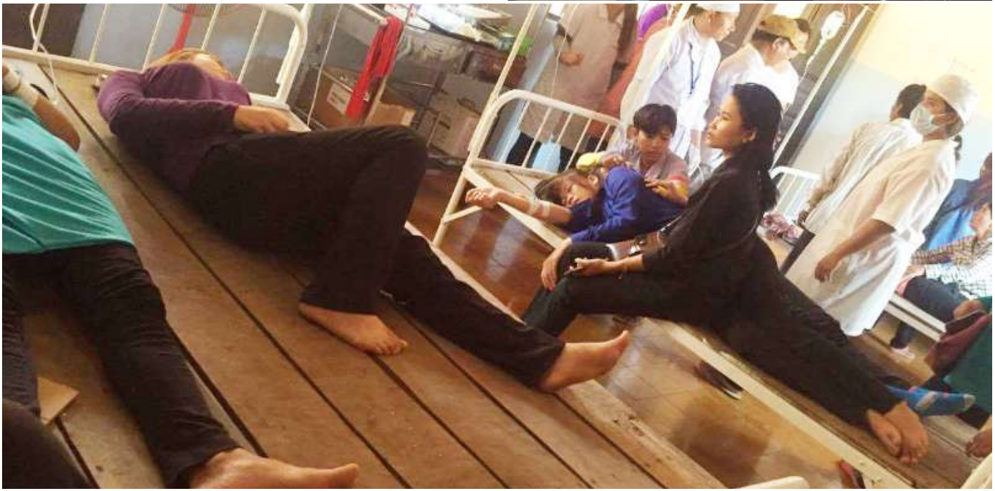
រូបភាពជនគ្រោះកំពុងសម្រាកព្យាបាលនៅមន្ទីរពេទ្យ