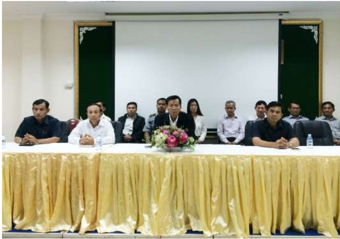
នាយក ប.ស.ស រៀបចំពិធីអបអរ ០៨មីនា ទិវាសិទ្ធិនារីអន្តរជាតិ

កាលពីថ្ងៃទី០៧ ខែមីនា ឆ្នាំ២០១៦ បេឡាជាតិរបបសន្តិសុខសង្គម បានរៀបចំពិធីទិវាសិទ្ធិនារីអន្តរជាតិ (International Women's Rights Day) ០៨ មីនា ខួបលើកទី១០៥ លើប្រធានបទ "វិនិយោគលើសមភាពយេនឌ័រដើម្បីកិច្ចអភិវឌ្ឍន៍ប្រកបដោយចីរភាព" ក្រោមការដឹកនាំដោយលោក អ៊ុក សមវិទ្យា នាយកបេឡាជាតិរបបសន្តិសុខសង្គម និង សិក្ខាកាមដែលជាមន្ត្រីបុគ្គលិក ប.ស.ស ចូលរួមជាច្រើនរូប។ ពិធីនេះធ្វើឡើងរំលឹកដល់សន្និសីទទីក្រុង Copenhagen ប្រទេសដាណឺម៉ាក ដោយមានការចូលរួមពីនារីជាង ១០០នាក់ មកពី ១៧ប្រទេស ក្នុងចំណោមនោះមាននារី០៣នាក់ ត្រូវបានជាប់ឆ្នោតតំណាងរាស្ត្រសភាហ្វ្យាងឡង់ផងដែរ។