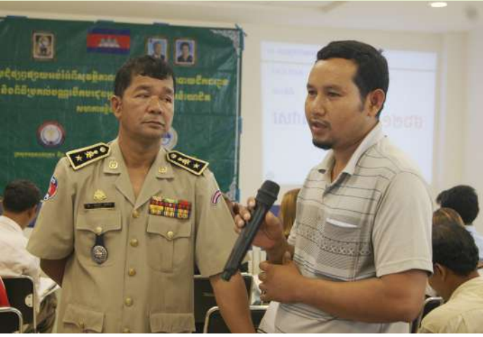
ការឡើងបញ្ចេញមតិរបស់សិក្ខាកាមក្នុងអង្គពិធី

និងដឹកជញ្ជូន បណ្តុះបណ្តាលគ្រូបង្គោលផ្នែកសុវត្ថិភាពចរាចរណ៍ ដល់រដ្ឋបាលរោងចក្រ សហជីពមូលដ្ឋាន និងបណ្តុះបណ្តាលប្រឡង យកបណ្ណបើកបរដល់អ្នកបើកបរដឹកកម្មករនិយោជិតដែលគ្មានបណ្ណ បើកបរនៅតាមរោងចក្រ។