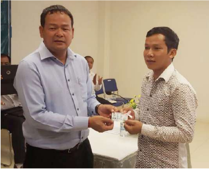
សកម្មភាពការផ្តល់បណ្ណបើកបរជូនអ្នកបើកបរដឹកកម្មករនិយោជិត