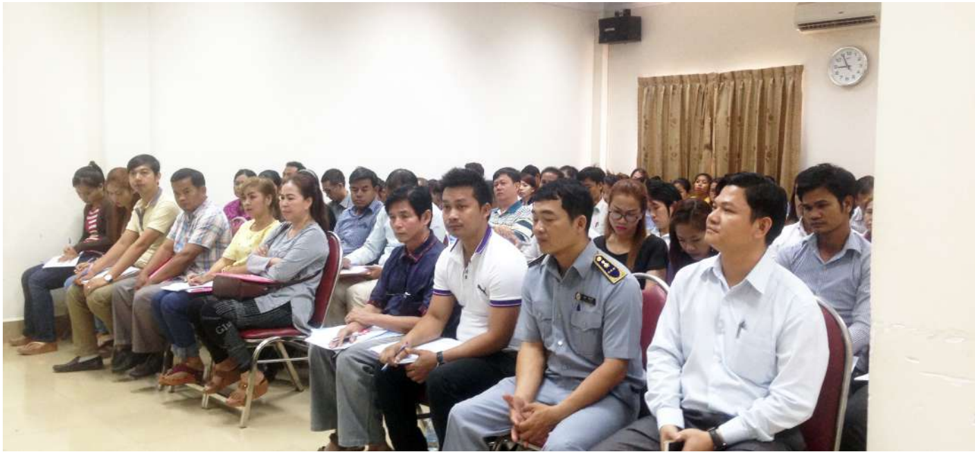
សិក្ខាកាមដែលជាតំណាងរោងចក្រ សហគ្រាស គ្រឹះស្ថាន និងតំណាងសហជីពមូលដ្ឋានចូលរួមក្នុងកិច្ចប្រជុំ