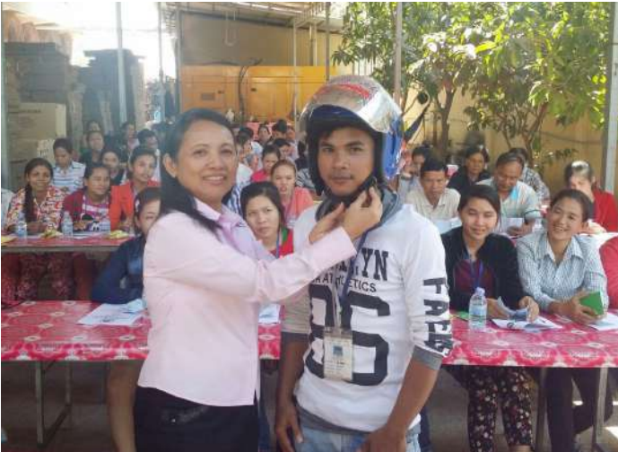
ពិធីផ្តល់មូកសុវត្ថិភាពដល់សិក្ខាកាមចូលរួម

ទន្ទឹមគ្នានេះកាលពីថ្ងៃទី២៨ ខែមករា ឆ្នាំ២០១៦ ក្រុមការងារស.ផ.ក បានរៀបចំកិច្ចប្រជុំផ្សព្វផ្សាយអប់រំអំពីច្បាប់ ស្តីពីចរាចរណ៍ផ្លូវគោក និងសុវត្ថិភាពធ្វើដំណើររបស់កម្មករនិយោជិត និងបាន