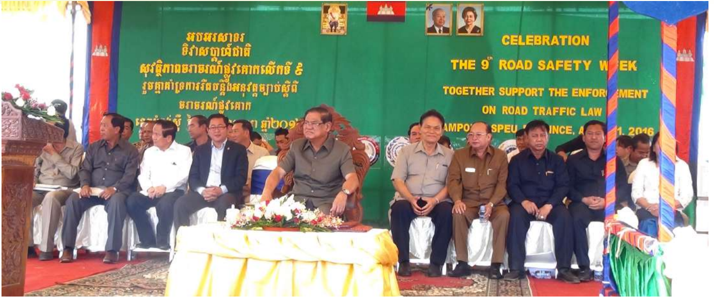
សម្តេចក្រុងហោម ស ខេង អញ្ជើញជាអធិបតីក្នុងពិធីទិវាសប្តាហ៍ជាតិសុវត្ថិភាពចរាចរណ៍ផ្លូវគោកលើកទី៩ នៅខេត្តកំពង់ស្ពឺ

កាលពីរសៀលថ្ងៃទី១១ ខែមេសា ឆ្នាំ២០១៦ បេឡាជាតិរបបសន្តិសុខសង្គម (ប.ស.ស) បានសហការជាមួយអាជ្ញាធរខេត្តកំពង់ស្ពឺ រៀបចំប្រារព្ធពិធីទិវាសប្តាហ៍ជាតិសុវត្ថិភាពចរាចរណ៍ផ្លូវគោកលើកទី៩ នៅកីឡដ្ឋានខេត្តកំពង់ស្ពឺ ក្រោមអធិបតីភាព សម្តេចក្រុងហោម ស ខេង ឧបនាយករដ្ឋមន្ត្រី រដ្ឋមន្ត្រីក្រសួងមហាផ្ទៃ និងជាប្រធានគណៈកម្មាធិការជាតិសុវត្ថិភាពចរាចរណ៍ផ្លូវគោក អមដោយឯកឧត្តមរដ្ឋមន្ត្រី ឯកឧត្តមអភិបាល នៃគណៈអភិបាលខេត្តកំពង់ស្ពឺ និងមានសមាសភាពចូលរួមពី លោកក្រូ អ៊ុកក្រូ សិស្សានុសិស្សយុវជន កាកបាទក្រហម កាយវិទ្ធុ បងប្អូនកម្មករនិយោជិត និងអ្នកបើកបរដឹកជញ្ជូនកម្មករនិយោជិតប្រមាណជាង ២០០០ នាក់។