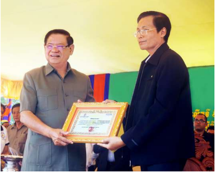
សម្តេចក្រឡាហោម ស ខេង ផ្តល់បណ្ណសរសើរ ជូនលោកនាយក ប.ស.ស

សម្តេចក្រឡាហោម ស ខេង អញ្ជើញថ្លែងសុន្ទរកថាក្នុងអង្គពិធីជាមួយគ្នានេះ ប.ស.ស កំពុងរៀបចំដាក់ឱ្យអនុវត្តផ្នែកប្រាក់សោធននិវត្តន៍ ដែលជាជំហានទី៣ របស់ខ្លួន នៅឆ្នាំ២០១៧ ខាងមុខ គម្រោងនេះមានគោលដៅលើកកម្ពស់សិទ្ធិមនុស្សសម្រាប់ជនចាស់ជរា ខាងវិស័យឯកជនដែលធ្វើការមិនកើតមានសិទ្ធិទទួលបានប្រាក់ចូលនិវត្តន៍ដូចមន្ត្រីរាជការដែរ។