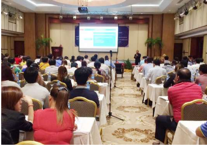
សិក្ខាកាមតំណាងរដ្ឋបាលរោងចក្រ សហគ្រាសគ្រឹះស្ថាន សហជំពង់មូលដ្ឋាន និងអង្គការពាក់ព័ន្ធចូលរួមក្នុងកិច្ចប្រជុំ

ដើម្បីភាពងាយស្រួលក្នុងការបម្រើសេវាសាធារណៈជូនដល់បងប្អូនកម្មករនិយោជិត ដែលជាសមាជិក ប.ស.ស ឱ្យបានត្រឹមត្រូវ