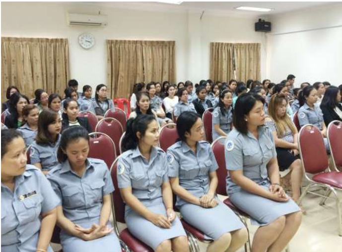
សិក្ខាកាមដែលជាមន្ត្រីបុគ្គលិក ប.ស.ស ចូលរួមក្នុងពិធី

ពិធីប្រគល់រង្វាន់លើកទឹកចិត្ត ដល់មន្ត្រី បុគ្គលិក ប.ស.ស ដែលជានារីក្នុងអង្គពិធីគោលបំណងនៃប្រធានបទនេះ គឺធ្វើការបំផុស និងកៀងគរ ប្រជាពលរដ្ឋទាំងអស់នៅក្នុងប្រទេសកម្ពុជាឱ្យធ្វើការរួមគ្នា ដើម្បីឱ្យសម្រេចបាននូវសមភាពដ៏ពិតប្រាកដរវាងបុរស និង ស្ត្រី ក៏ដូចជាដើម្បីឱ្យ មានការទទួលស្គាល់ថាស្ត្រី គឺជាភ្នាក់ងារដ៏សំខាន់ដែលមានតួនាទីធ្វើឱ្យសង្គមផ្លាស់ប្តូរមុខមាត់ថ្មី។