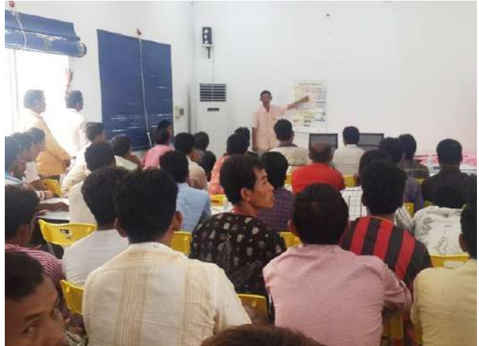
បទបង្ហាញដោយគ្រូឧទ្ទេស ស្តីពីច្បាប់ចរាចរណ៍ផ្លូវគោកថ្មី។

សហការណ៍ជាមួយក្រសួងសាធារណការ និងដឹកជញ្ជូន រៀបចំប្រជុំផ្សព្វផ្សាយអប់រំនេះឡើង ដើម្បីណែនាំដល់កម្មករនិយោជិតឱ្យបានយល់ច្បាស់ពីច្បាប់ស្តីពីចរាចរណ៍ផ្លូវគោក បច្ចេកទេសត្រួតពិនិត្យយានយន្តប្រចាំថ្ងៃ និងវិជ្ជាសង្គ្រោះបឋម ដល់កម្មករនិយោជិត និងអ្នកបើកបរដឹកកម្មករនិយោជិត នៅរោងចក្រ Golden Apparel (Cambodia) Ltd. ទាំងអស់ ដើម្បីរួមចំណែកទប់ស្កាត់ករណីគ្រោះថ្នាក់ចរាចរណ៍ឱ្យនៅកម្រិតទាបបំផុត និងរួមចំណែកយ៉ាងសកម្ម