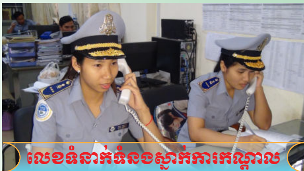
លេខទំនាក់ទំនងស្នាក់ការកណ្តាល

០២៣ ៩៩៨ ៤១៩ / ០២៣ ៩៩៨ ៤១៨ ០២៣ ៨៨២ ៦២៣ / ០២៣ ៩៩៨ ៤១៧ ០២៣ ៨៨១ ១៧៦ / ០២៣ ៧២២ ៣០៨ ០២៣ ៧២២ ៣០៧ / ០២៣ ៧២២ ៣៧៨ ០២៣ ៧២២ ៣៧៩ / ០២៣ ៧២២ ៣៩០ ០២៣ ៨៨១ ១៣៩ / ០២៣ ៨៨២ ៤៣៤