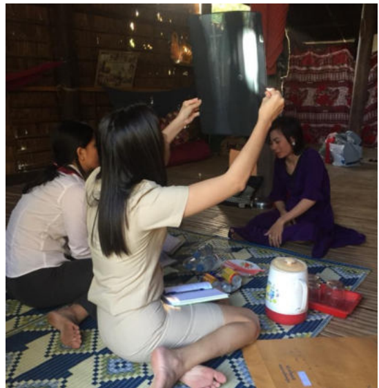
ការពិនិត្យហ្វីល ជនរងគ្រោះទី១

តាមការពិនិត្យហ្វីល ដែលជនរងគ្រោះបានទៅពិនិត្យព្យាបាលនៅមន្ទីរពេទ្យកាល់ម៉ែត ឃើញថាជួរស្រាលច្រើនឆ្លឹងបានដុះមកវិញជាបណ្តើរៗ ហើយ ប.ស.ស បានផ្តល់នូវរទេះជនពិការមួយ និងឈើច្រត់មួយ។