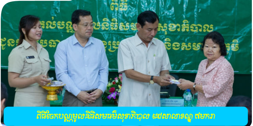
ពិធីចែកបន្តបន្ទាប់និវេទនាបរិសុទ្ធាភិបាល នៅសាលាខណ្ឌ ៥មករា