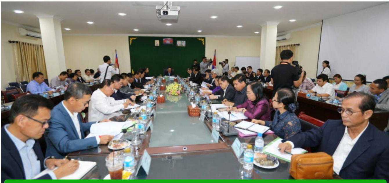
កិច្ចប្រជុំដើម្បីរកក្របវិធីសាស្ត្រទប់ស្កាត់នូវករណីជួលសន្លប់ របស់បច្ចុប្បន្ន កម្មករនិយោជិត នៅតាមរោងចក្រ សហគ្រាស

ភ្នំពេញ៖ ដើម្បីអនុវត្តទៅតាមអនុសាសន៍ដ៏ខ្ពង់ខ្ពស់របស់ សម្តេចអគ្គមហាសេនាបតីតេជោ ហ៊ុន សែន នាយករដ្ឋមន្ត្រី នៃព្រះរាជាណាចក្រកម្ពុជា ក្នុងការបង្កើនការយកចិត្តទុកដាក់លើបញ្ហាជួលសន្លប់របស់កម្មករនិយោជិត គណៈកម្មាធិការជាតិសុខភាព និងសុវត្ថិភាពការងារ ដើម្បីទប់ស្កាត់ករណីជួលសន្លប់ ដែលមាន ៦កខត្តមបណ្ឌិត អ៊ុត សំហេង រដ្ឋមន្ត្រីក្រសួងការងារ និងបណ្តុះបណ្តាលវិជ្ជាជីវៈ ជាប្រធានបានបើកកិច្ចប្រជុំជាលើកទី១ ដើម្បីរកឱ្យឃើញ នូវករណីជួលសន្លប់ឈានទៅទប់ស្កាត់និងលុបបំបាត់ឱ្យបានទាំងស្រុង។ កិច្ចប្រជុំនេះ ធ្វើឡើងនៅទីស្តីការក្រសួងការងារ និងបណ្តុះបណ្តាលវិជ្ជាជីវៈ កាលពីថ្ងៃអង្គារ ១៣រោច ខែមាយ ឆ្នាំរកា នព្វស័ក ព.ស.២៥៦១ ត្រូវនឹងថ្ងៃទី១៣ ខែកុម្ភៈ ឆ្នាំ២០១៨