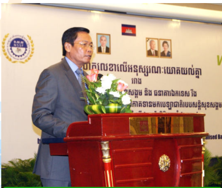
ឯកឧត្តមប្រតិភូ ថ្លែងសុន្ទរកថា

ភ្នំពេញ៖ បេឡាជាតិរបបសន្តិសុខសង្គម (ប.ស.ស) បានចុះហត្ថលេខាលើអនុស្សាវរណៈយោគយល់គ្នាស្តីពីការប្រើប្រាស់សេវាកម្មរវាង បេឡាជាតិរបបសន្តិសុខសង្គម និងធនាគារឯកទេសវិទ (ខេមបូឌា) លីមីតធីត ដែលបានប្រព្រឹត្តទៅនៅសណ្ឋាគារ កំបូឌីយ៉ាណា។