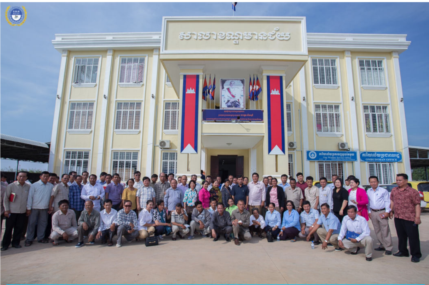
ក្រុមស្រុកពន្ធសុទ្ធាភិបាល នៅសាលាខណ្ឌមានជ័យ