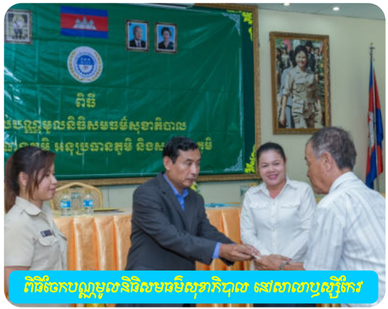
ពិធីចែកបន្តបន្ទាប់និវេទនាបរិសុទ្ធាភិបាល នៅសាលាបន្ទីរកែប្រែ