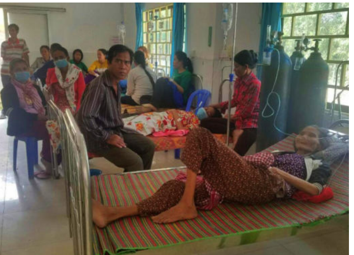
រូបភាពនរណាគ្រោះកំពុងសម្រាកព្យាបាលនៅមន្ទីរពេទ្យ