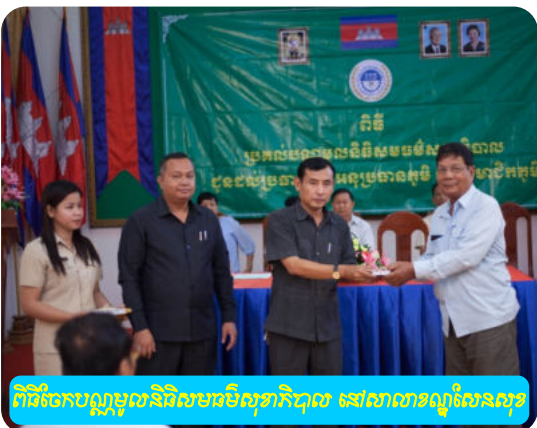
ពិធីចែកបន្តបន្ទាប់និវេទនាបរិសុទ្ធាភិបាល នៅសាលាខណ្ឌសែនសុភ័ក្ត្រ