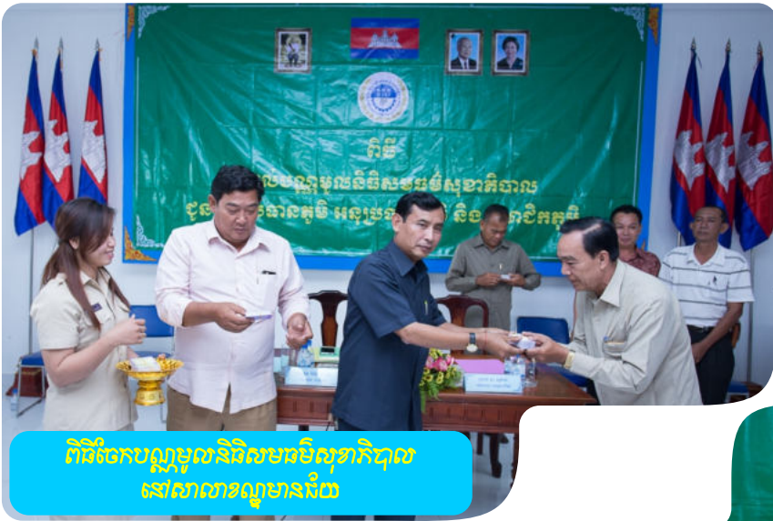
ពិធីចែកបន្តបន្ទាប់និវេទនាបរិសុទ្ធាភិបាល នៅសាលាខណ្ឌមានជ័យ