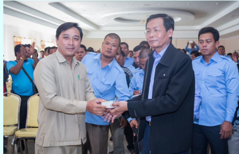
ពិធីប្រគល់បណ្ណមូលនិធិសមធម៌ជូនដល់សមាគមម៉ូតូកង់ប៊ី

គោលរបបឧបត្ថម្ភជាសាច់ប្រាក់នេះ ទោះសម្រាលមកកូននោះស្លាប់ក៏ទទួលបានដែរ។