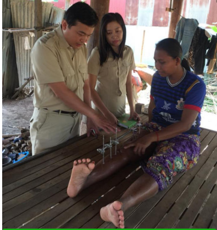
រូបភាព: ជនរងគ្រោះទី៤

ជាការពិតណាស់រាជរដ្ឋាភិបាលបានដាក់ចេញនូវផែនការយុទ្ធសាស្ត្រជាតិស្តីពីពិការភាព ២០១៤-២០១៨ ដែលជា ផែនទីបង្ហាញផ្លូវរយៈពេលមធ្យម ដើម្បីកំណត់ឱ្យបានច្បាស់នូវគោលនយោបាយ និងការទទួលខុសត្រូវរបស់ស្ថាប័ននីមួយៗ ដែលពាក់ព័ន្ធនឹងការលើកកម្ពស់សុខុមាលភាពជនពិការ។