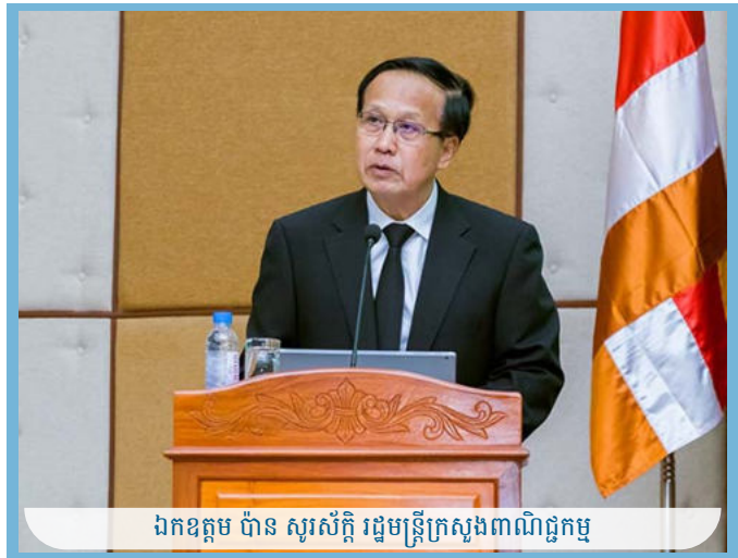
ឯកឧត្តម ប៉ាន សូរស័ក្តិ រដ្ឋមន្ត្រីក្រសួងពាណិជ្ជកម្ម

ឯកឧត្តម ប៉ាន សូរស័ក្តិ រដ្ឋមន្ត្រីក្រសួងពាណិជ្ជកម្មបានលើកឡើងថា៖ នេះជាលើកដំបូងហើយ ដែលបេឡាជាតិរបបសន្តិសុខសង្គម បានផ្តល់ប័ណ្ណសមាជិក ប.ស.ស សម្រាប់ថ្នាក់ដឹកនាំ មន្ត្រីរាជការ និងមន្ត្រីជាប់កិច្ចសន្យា នៃក្រសួងពាណិជ្ជកម្ម។ ឯកឧត្តម បានបន្តទៀតថា៖ របបសន្តិសុខសង្គមផ្នែកហានិភ័យការងារ សម្រាប់មន្ត្រីសាធារណៈ និងផ្នែកថែទាំសុខភាពសម្រាប់មន្ត្រី សាធារណៈ អតីតមន្ត្រីរាជការ និងអតីតយុទ្ធជន គឺជាគោលនយោបាយដ៏ល្អមួយក្នុងការឆ្លើយតបទៅនឹងការរក្សាសុខុមាលភាព និងលើកកម្ពស់ជីវភាពរស់នៅរបស់មន្ត្រីសាធារណៈ អតីតមន្ត្រីរាជការ និងអតីតយុទ្ធជនឱ្យកាន់តែល្អប្រសើរឡើង។