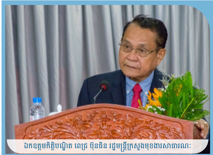
ឯកឧត្តមកិត្តិបណ្ឌិត ពេជ្រ ប៊ុនធីន រដ្ឋមន្ត្រីក្រសួងមុខងារសាធារណៈ

បេឡាជាតិរបបសន្តិសុខសង្គម (ប.ស.ស) នៃក្រសួងការងារ និងបណ្តុះបណ្តាលវិជ្ជាជីវៈ កាលពីថ្ងៃចន្ទ ៥កើត ខែកត្តិក ឆ្នាំច សំរឹទ្ធិស័ក ព.ស.២៥៦២ ត្រូវនឹងថ្ងៃទី១២ ខែវិច្ឆិកា ឆ្នាំ២០១៨ នេះ បានសហការជាមួយ ក្រសួងមុខងារសាធារណៈ រៀបចំពិធីចែកប័ណ្ណសមាជិក ប.ស.ស ជូនដល់ថ្នាក់ដឹកនាំ មន្ត្រីរាជការ និងមន្ត្រីជាប់កិច្ចសន្យា នៃក្រសួងមុខងារសាធារណៈ ចំនួន ៨៤៣ប័ណ្ណ ដើម្បីឱ្យពួកគាត់ទទួលបានសេវាថែទាំសុខភាពនៅមូលដ្ឋានសុខាភិបាល ដែលបានចុះកិច្ចព្រមព្រៀងជាមួយ ប.ស.ស ។