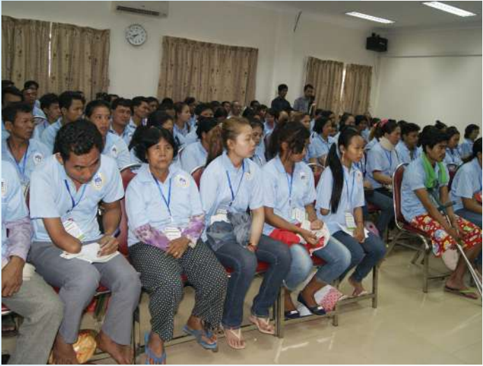
ការចូលរួមរបស់សមាជិក និងអគ្គគាហក (អ្នកនៅក្នុងបន្ទុក) ក្នុងពិធីសំណេះសំណាល

ពេលដែលកម្មករនិយោជិតទទួលបានរងគ្រោះថ្នាក់ (ជាគ្រោះថ្នាក់ការងារ) គាត់នឹងទទួលបានការកាត់បន្ថយប.ស.ស មានដូចជា៖ (ការព្យាបាលរហូតជាសះស្បើយ, ប្រាក់បំណាច់ប្រចាំថ្ងៃ, គ្រោះថ្នាក់ក្រោម២០% ជាវិភាជន៍, ចាប់ពី២០% ឡើងជាធនលាភសោហ៊ុយបូជាសព, ធនលាភខ្ពស់ជំងឺ, ការស្តារលទ្ធភាពពលកម្ម)។ ចាប់តាំងពីដំណើរការរបបសន្តិសុខសង្គម ផ្នែកហានិភ័យការងារ (គ្រោះថ្នាក់ការងារ) ក្នុងខែវិច្ឆិកា ឆ្នាំ២០០៨ រហូតមក ដល់ពេលបច្ចុប្បន្ននេះ ប.ស.ស បានផ្តល់សេវាព្យាបាលជូនកម្មករនិយោជិត ដែលទទួលបានរងគ្រោះថ្នាក់ការងារបានចំនួន ៨៣.៦១២នាក់ ក្នុងចំណោមជនរងគ្រោះទាំងនោះមានអ្នកស្លាប់ចំនួន ៣៩៦នាក់ របួសធ្ងន់ចំនួន ៤.៨៨១នាក់ របួសស្រាលចំនួន ៧៨៣៣៥នាក់។ ពិធីសំណេះសំណាលនេះវាពិតជាមានសារៈសំខាន់ណាស់ ព្រោះវាបានបង្ហាញពីការយកចិត្តទុកដាក់ និងសួរសុខទុក្ខដល់បងប្អូនកម្មករនិយោជិត ដែលទទួលបានរងគ្រោះថ្នាក់ការងារ និងអ្នកនៅក្នុងបន្ទុកផ្ទាល់ អំពីការលំបាករបស់ពួកគាត់ និងចូលរួមជាយោបល់ ឬសំណូមពរដើម្បីកែលំអរសេវាកម្មរបបសន្តិសុខសង្គមឱ្យបានកាន់តែប្រសើរថែមទៀត។