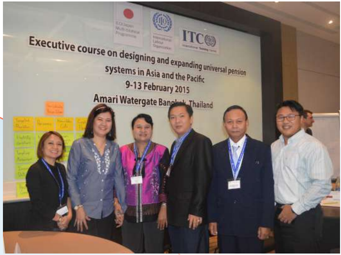
ទិទ្ធភាពចូលរួមក្នុងវគ្គបណ្តុះបណ្តាល

ប្រជាជនដែលគ្រប់គ្រង ដោយក្រសួងសុខាភិបាល គឺមាន គោលនយោបាយផ្តល់ប្រាក់ ៣០០ Bath (សម្រាប់វិស័យមិនរៀប រយរបស់រដ្ឋាភិបាលប្រទេសខ្លួន)។