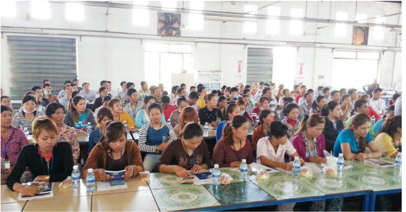
សិក្ខាកាមដែលជាកម្មករនិយោជិតចូលរួមកម្មវិធីប្រជុំ