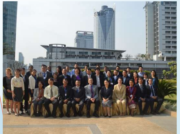
ការថតរូបអនុស្សាវរី បន្ទាប់ពីបញ្ចប់វគ្គបណ្តុះបណ្តាល

ស្របពេលជាមួយគ្នានេះ ប.ស.ស បានបញ្ជូនមន្ត្រីជំនាញចូល រួមក្នុងវគ្គបណ្តុះបណ្តាលស្តីពីការគ្រប់គ្រង និងចាត់ចែងហិរញ្ញ វត្ថុនៃរបបប្រាក់សោធន នៅប្រទេសថៃ។