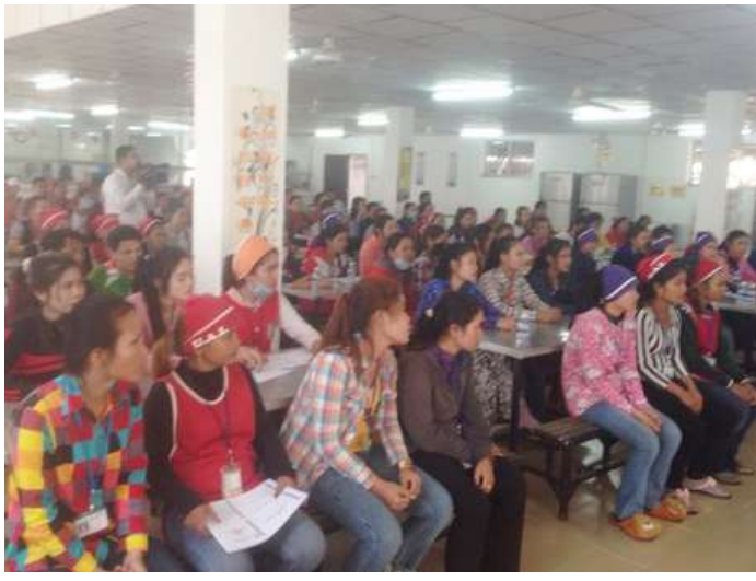
សកម្មភាពចូលរួមរបស់សិក្ខាកាមក្នុងអង្គពិធី

ការដឹកជញ្ជូន និងការព្យាបាលជនរងគ្រោះ គឺស្ថិតនៅក្រោមការ ចំណាយផ្ទាល់របស់បេឡាជាតិរបបសន្តិសុខសង្គម។