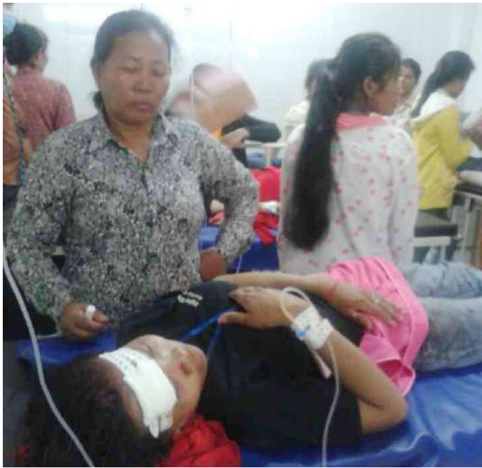
រូបភាពជនរងគ្រោះកំពុងសម្រាកព្យាបាលនៅមន្ទីរពេទ្យសម្រួល និងបញ្ជូនជនរងគ្រោះទៅសម្រាកព្យាបាលនៅគ្លីនិកផ្តល់ទទឹង។

នៅព្រឹកថ្ងៃទី២៨ ខែមេសា ឆ្នាំ២០១៥ វេលាម៉ោង៦:៣០នាទី មានឧបទ្វីបហេតុគ្រោះថ្នាក់ចរាចរណ៍មួយ នៅលើកំណាត់ផ្លូវជាតិលេខ៤ ម្តុំផ្តល់ទទឹង នៅទល់មុខរោងចក្រ Waifull Garment ដែលបង្កដោយរថយន្តដឹកកម្មករមួយគ្រឿងបានបើកទៅកៀ ជាមួយរថយន្តដឹកកម្មករមួយគ្រឿងទៀត ដែលជារថយន្តរបស់ជនរងគ្រោះបណ្តាលឱ្យបាក់ទ្រុឌ បង្កឱ្យកម្មការិនី ១៣នាក់ ទទួលរងរបួស។