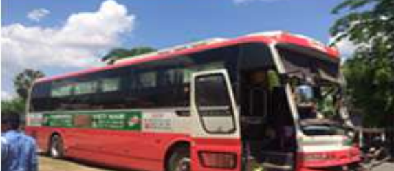
ទិដ្ឋភាពគ្រោះថ្នាក់ចរាចរណ៍នៅខេត្តស្វាយរៀង