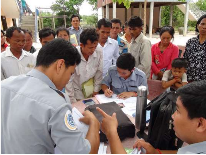
សកម្មភាពចូលរួមវិលកទុក្ខ និងនាំយកប្រាក់វិភាជន៍សម្រាប់បូជាសពផ្តល់ជូនក្រុមគ្រួសារសព (អ្នកនៅក្នុងបន្ទុកផ្ទាល់នៃជនរងគ្រោះ)