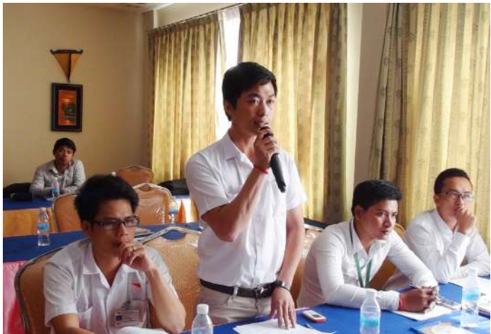
ការឡើងបញ្ចេញមតិរបស់សិក្ខាកាមក្នុងអង្គពិធី