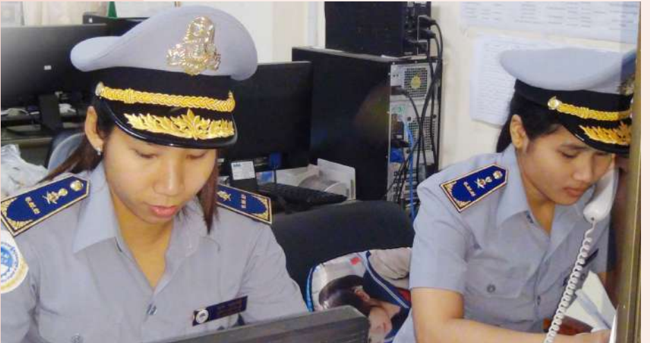
សកម្មភាពទំនាក់ទំនងការងារ របស់អតិថិជនជាមួយក្រុមការងារ Hotline

ទន្ទឹមនឹងទទួលបានលទ្ធផលជាផ្លែផ្កាក្តីក៏នៅមានបញ្ហាប្រឈមមួយចំនួនដែរ ដែលតម្រូវឱ្យក្រុមការងារ HOTLINE នៅតែខិតខំប្រឹងប្រែងដោះស្រាយ រាល់ការប្រឈមនោះឱ្យមានភាពរលូន និងរហ័សទាន់ ពេលវេលាដើម្បីបម្រើសេវាសាធារណៈ ជូនដល់សមាជិក នៃបេឡាជាតិរបបសន្តិសុខសង្គម ឱ្យបានល្អបន្ថែមទៀត។